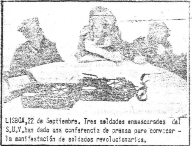
LISBOA, 22 de Septiembre. Tres soldados enmascarados del S.U.V. han dado una conferencia de prensa para convocar a la manifestación de soldados revolucionarios.