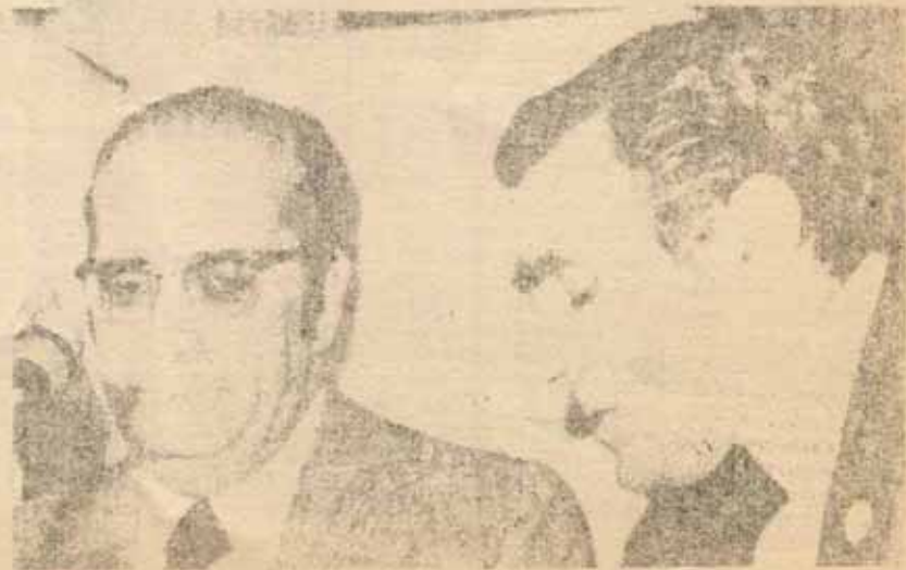
El presidente Costa Gomes y el "premier" Pinheiro de Acedo.