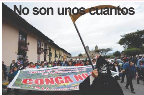
Hablan las imágenes

Humala y las otras autoridades, arrodillados al servicio de los millones de las empresas, desarrollan la política de matar a balazos a los peruanos trabajadores pobres, defensores del agua y de la vida, en Cajamarca, Islay, Espinar y otras zonas.