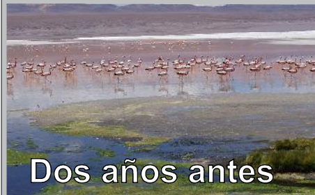
Dos años antes

Nos atañe finalmente porque pone ante nosotros los efectos del cambio climático y de las políticas deficientes frente a él. Una revisión de los planes de gobierno en este esencial aspecto demostrará la riesgosa subestimación que se hace de sus potenciales efectos