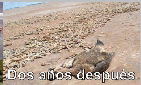
Dos años después