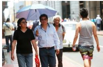
En Lima seguirá el intenso calor con el que empezó este verano. Igualmente la radiación solar llegará a niveles de riesgo para la salud.

"Debido al aumento de temperatura del cuerpo por una exposición prolongada al sol o por hacer ejercicios en ambientes calurosos o con poca ventilación, al punto que el cuerpo pierde agua y sales esenciales para su buen funcionamiento", anotó.