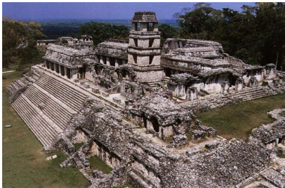
Santuario de Copán en Honduras, donde los maya chortís están prohibidos de ingresar a realizar sus tradicionales ceremonias espirituales

Los mercaderes del patrimonio cultural ajeno, banalizan, comercializan y