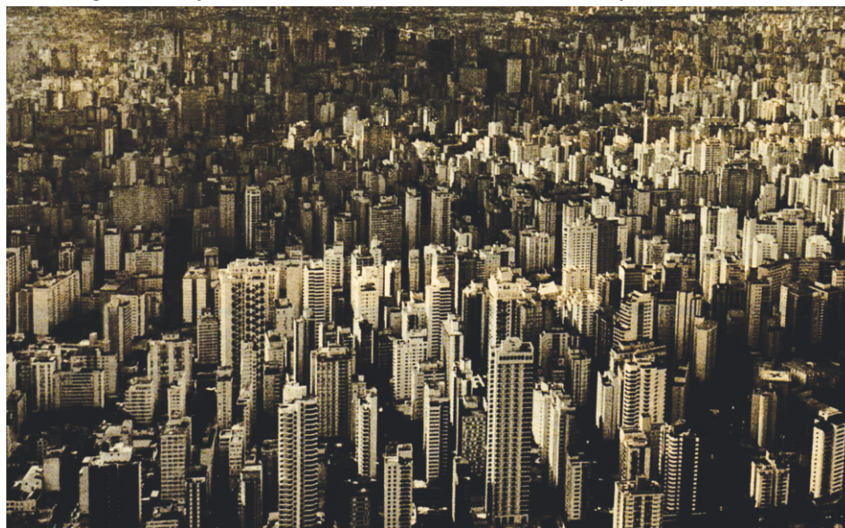
Metrópolis: ¿Estas las ha hecho el SOL?

En los países que se alinean tras las órdenes de las transnacionales y el capitalismo, con sus medios de comunicación, se suman al coro de responsabilizar al Sol de ser el principal causante de los desequilibrios atmosféricos y climáticos. La confirmación de lo que decimos, está en que guardan un silencio absoluto de las manifestaciones del calentamiento global. Cuando obligados por la realidad y las tragedias que originan a consecuencias del calentamiento global, solo se limitan a informes gaseosos y a la cuantificación estadística de daños y víctimas.