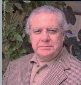
Por: Rodrigo Montoya Rojas

Participar en elecciones para elegir alcaldes, congresistas, representantes regionales y presidentes de la República es una novedad muy reciente para los pueblos indígenas. Los golpes de Estado dados por militares o civiles llenan buena parte de la historia de nuestro país. Elegimos presidentes de manera continua solo desde el año 2,001, luego del golpe de Fujimori y Montesinos en 1992 y sus elecciones amañadas de 1995 y 2,000. En Estados Unidos se elige presidentes desde la fundación de la república a fines del siglo XVIII y nunca tuvieron un golpe de Estado civil o militar, pero han apoyado a numerosos golpes de Estado en toda América Latina y en el mundo.