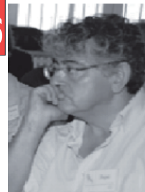
Por: Pepe Mejía, desde Madrid

El Gobierno se siente acorralado por los varios frentes abiertos y responde con mayor represión y criminalizando a los movimientos sociales. La última ha sido intentar vincular, con falsas acusaciones, a la Plataforma de Afectados por las Hipotecas (PAH) de mantener vínculos con el terrorismo. Una burda patraña que se le puede volver en contra. En esta misma línea se interpreta la detención de un joven que protestaba contra la privatización de la sanidad. Policías de paisano lo detuvieron fuera de la concentración y le