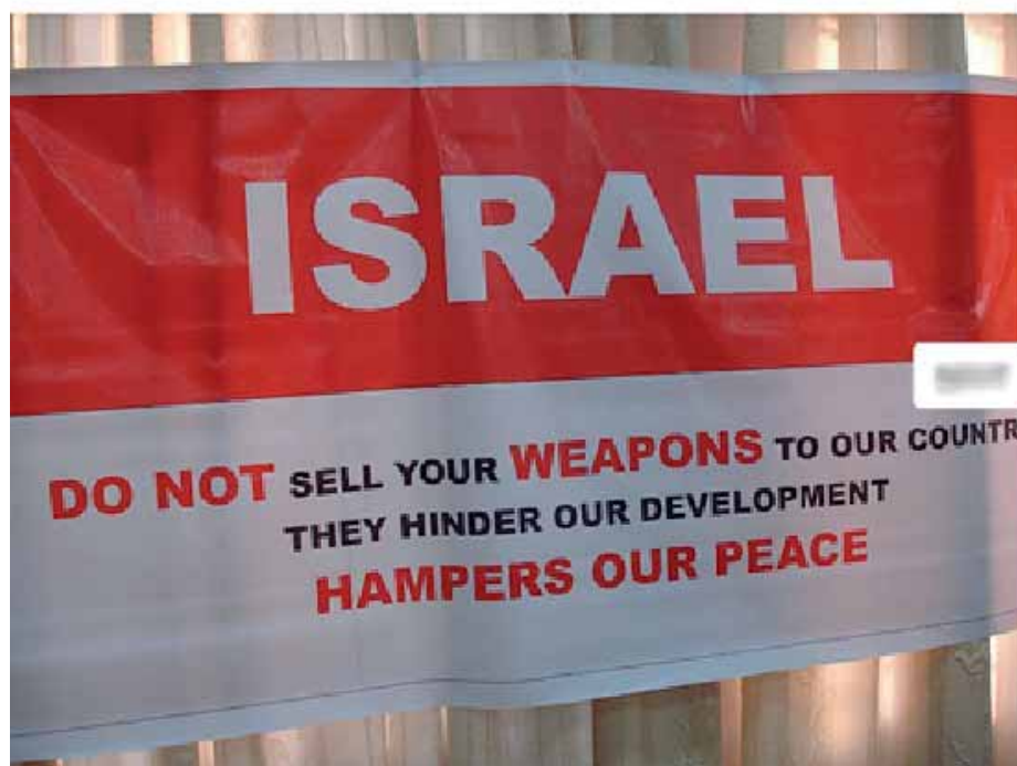
Pancarta exhibida en la Conferencia por el Desarme celebrada en la India