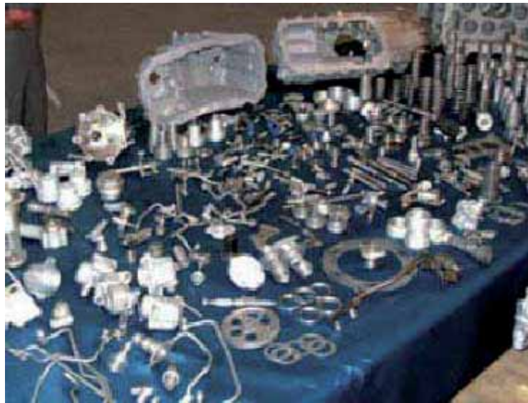
Armas israelíes vendidas a Irán durante el escándalo Irán-Contra