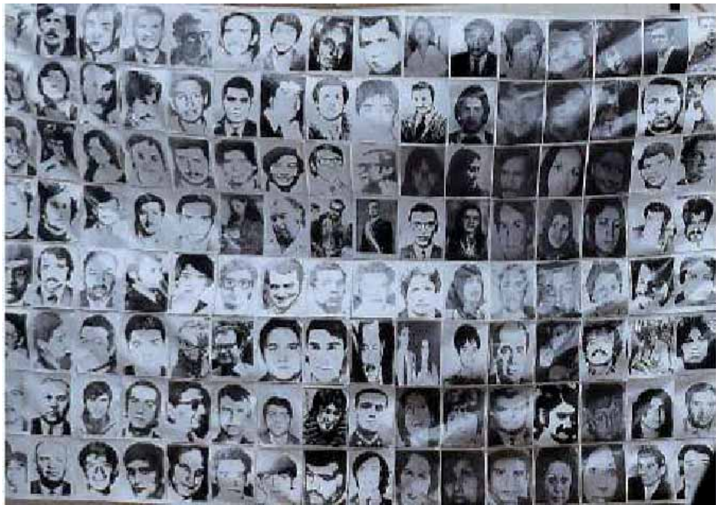
Los Desaparecidos de Chile