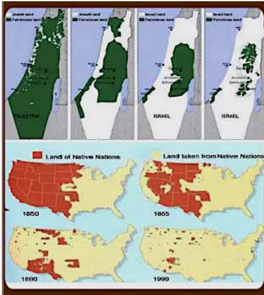
Evolución en el tiempo: Mapas de poblaciones nativas en Palestina y Estados Unidos

Israel y Estados Unidos comparten una forma de asentamientos coloniales por la cual los pueblos indígenas –más que explotados como trabajadores- sufren limpieza étnica, y los que permanecen son segregados y aislados en áreas cada vez más reducidas.