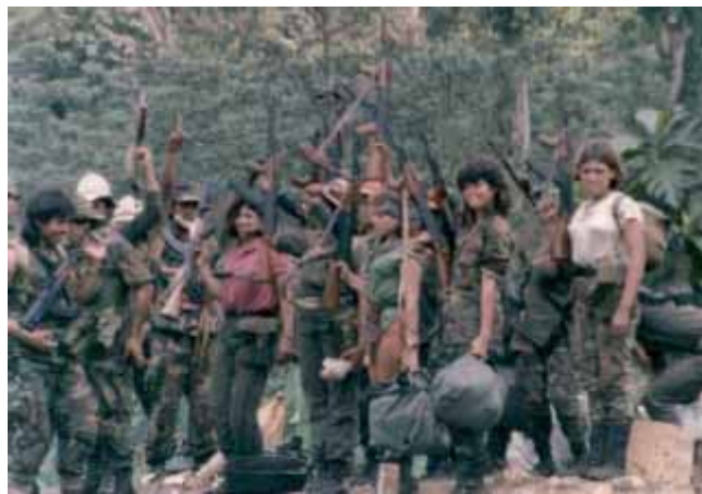
Jóvenes Contras armados con los rifles Galil de Israel