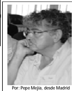
Por: Pepe Mejía, desde Madrid

Los mineros en la calle, – mientras que no hay ningún síntoma de que se vayan a sus casas- el Gobierno apretando el acelerador y sin estar dispuesto a ceder a las presiones de trabajadores y agentes sociales. Mientras, la realidad es más dura. Cientos y miles de personas cada día llenan la lista de personas sin empleo y sin ninguna perspectiva. Las movilizaciones se multiplican pero el catalizador sigue siendo la lucha de los mineros.