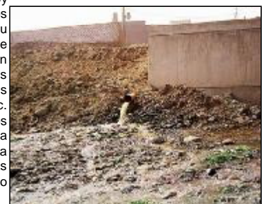
Descargas de aguas servidas de las plantas industriales.

Los limeños que tratan con tanta indiferencia los reclamos, marchas y movilizaciones por el agua, de nuestros hermanos del interior, deberían saber que el líquido que sale por nuestros caños, podría llegar a los que aun no tienen, mucho más limpio y barato, si el Estado normara las descargas de