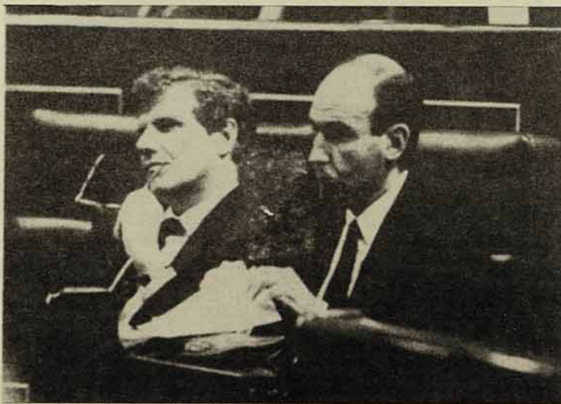
El senyor de la dreta és un dels redactors de l'Estatut

amb les seves sentències està configurant l'organització de l'autonomia. A finals del 89 tenia pendent de resolució quaranta assumptes, a conseqüència dels recursos presentats per diverses instàncies i tots estan relacionats amb l'aplicació de l'Estatut. És a dir des del T.C. s'està creant tota la teoria jurídica amb forta tendència estatalista que motiva que algunes forces polítiques reclamin la modificació del títol vuitè de la Constitució i eixamplar l'Estatut amb més transferències i canviar el model de finançament. El poble de Catalunya té molt clar que és el Parlament espanyol qui legisla sobre el règim fiscal, el dret a l'ensenyament, l'avortament, el divorci, la televisió privada i és conscient que el Parlament català no té poder per incidir de manera efectiva en els grans temes de la vida nacional catalana.