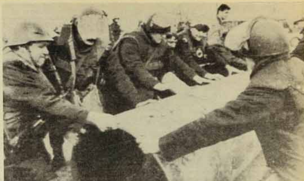
Localitat d'Urosevac, barricades dels nacionalistes albanesos