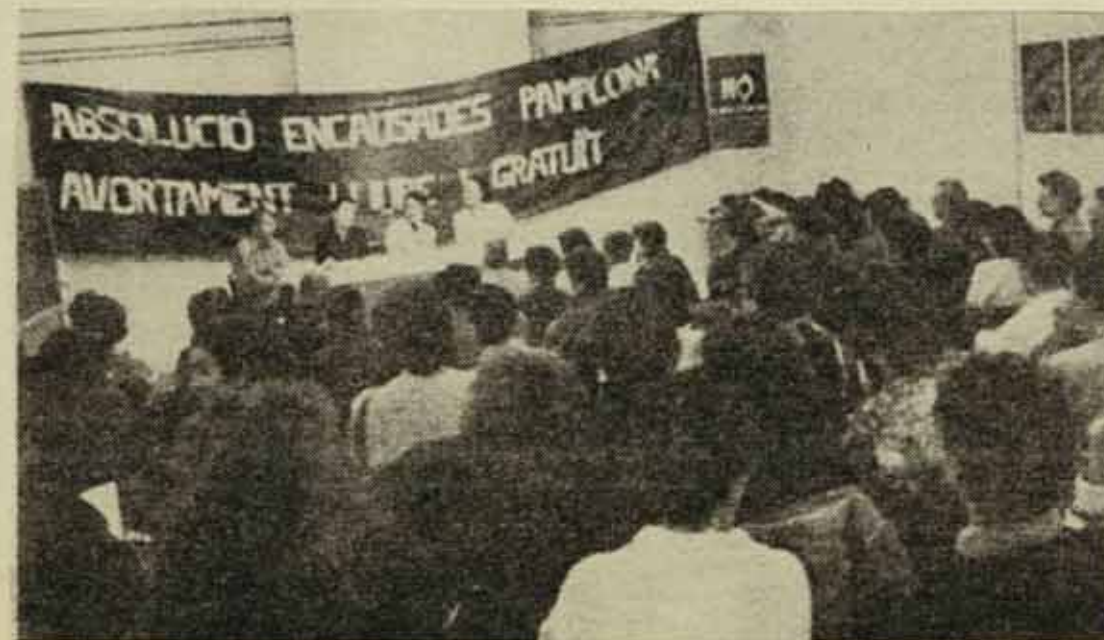
Acte a les Cotxeres contra el judici de Pamplona

Queden derogats els articles 411, 412, 13.414, 415, 416, 417 i 417 bis del Codi Penal i totes les lleis o disposicions administratives que s'oposin al que disposa aquesta Llei.