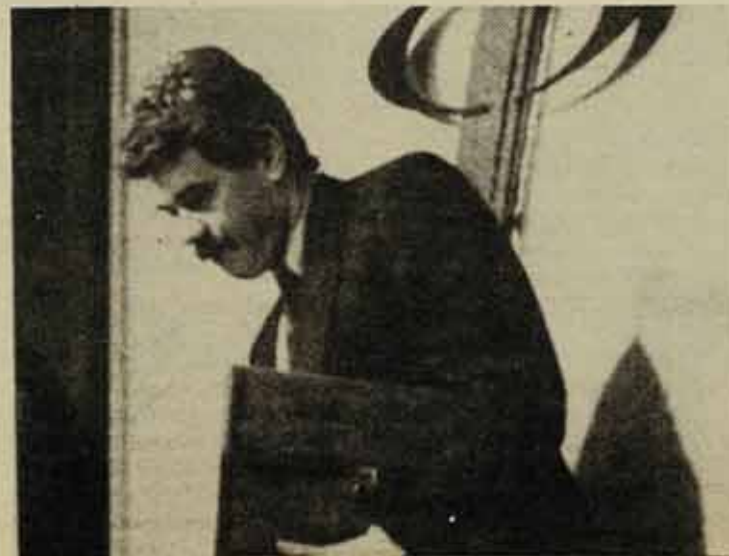
Arribarà al 92?