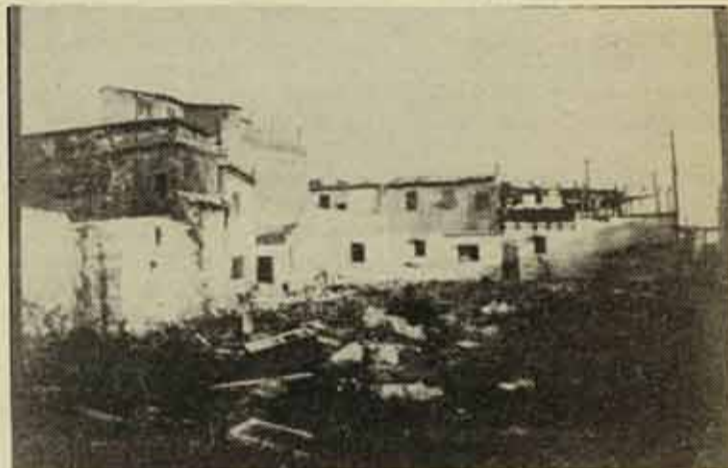
La Vila Olímpica ha destrossat el Poble Nou

Per acabar i aprofitar el temps, podem donar un volt per les cotxeres d'autobussos. Sempre hi tornarà a haver una vaga general i ja es sabuda quina és la feina dels piquets.