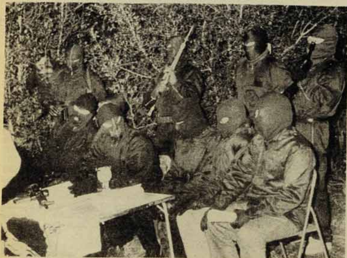
Un grup de guerrillers del F.L.N.C.