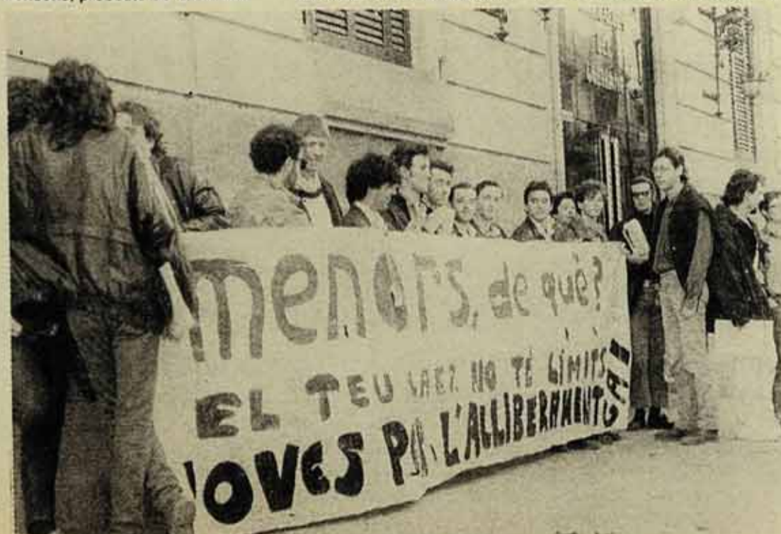
Concentració davant la Delegació del Govern durant les Trobades

Pertanyia a algun grup gai el 56%, no pertanyia a cap grup el 28%, i formaven part d'altres grups o moviments el 16%.