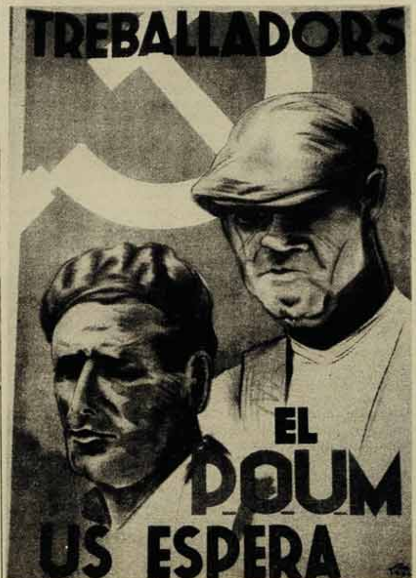
Un cartell del POUM del 1936