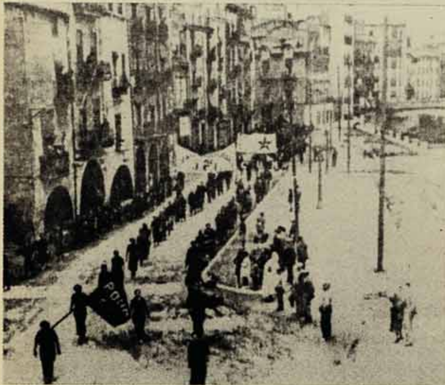
Manifestació del POUM i de les Joventuts Comunistes Ibèriques

Es torna a parlar d'Andreu Nin. En els darrers temps han estat nombrosos els debats, articles, "dossiers" de diaris —el darrer a "El Heraldo de Aragón"— i revistes ("EL Temps" del mes de desembre del 88), preses de posició, etc. sobre Nin i el seu "cas", tan particular i tan representatiu al mateix temps. Al capdavant de tot això s'hi troba la Fundació Andreu Nin creada amb aquest objectiu, que darrerament ha engegat una campanya dirigida al PCUS per aclarir definitivament la seva mort. Han donat resposta positiva el PSC, i el que és més important: el PSUC.