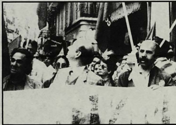
Mobilitzar? Com Dieu?

liar a gent que només ho fa per tenir unes vacances més barates, un descompte per la gestió d'unes assegurances, una possibilitat d'adquirir vivenda de forma més barata, una facilitat per viatjar més econòmicament... La mateixa gent que quan ve una vaga, alguna d'ella fa d'esquirol i no mereix no ja una sanció sinó ni tan sols un avís per part de la direcció del sindicat. No critiquem el fet que les CCOO ofereixi serveis a la seva afiliació (la història del moviment obrer té pàgines molt brillants on el