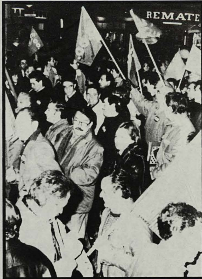
Per a la burocràcia, castigar a l'esquerra és més fàcil que no pas mobilitzar

Paral·lelament, la direcció de la CONC afavoreix un tipus d'afiliació passiva, que només demanda serveis. No discutim la pretensió d'un sindicat d'intentar afiliar al màxim número de persones, de no demanar cap pedigrí de combat per donar el carnet... però no a qualsevol preu. No a l'extrem d'afi-