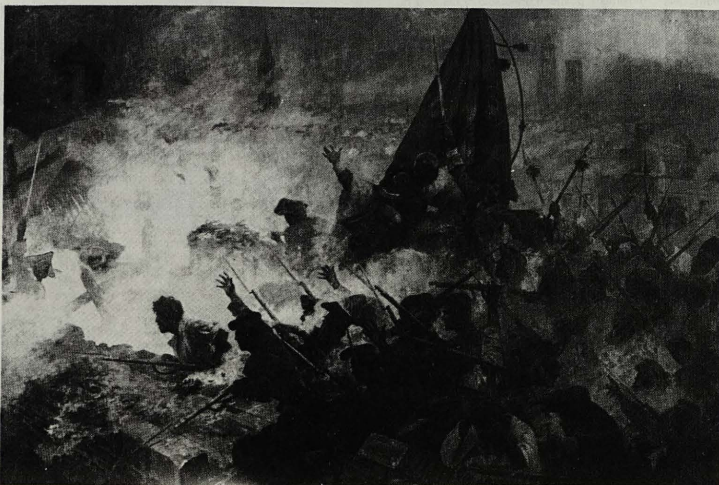
El "Mil.lenari" no té cap tradició popular, a diferència de l'11 de Setembre.