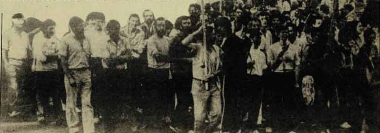
I la lluita?

Les primeres mesures de represió burocràtica van arri-