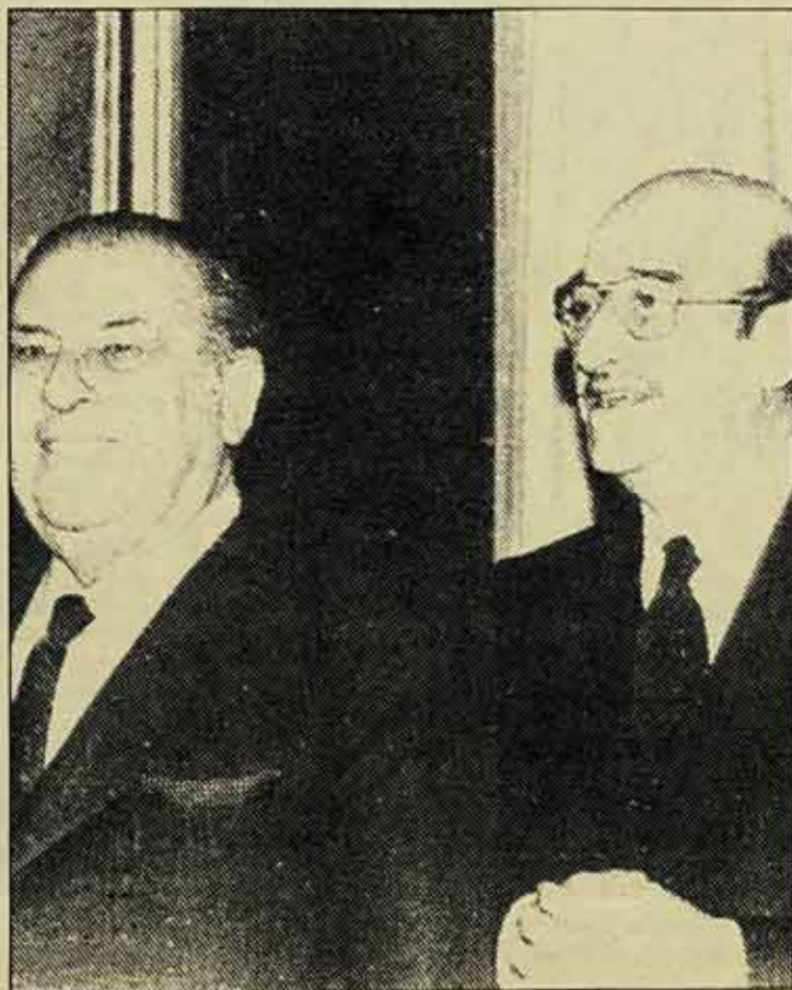
Va bé el negoci, eh?

Ens trobem aquí amb una multinacional, la Volkswagen, que té la majo-