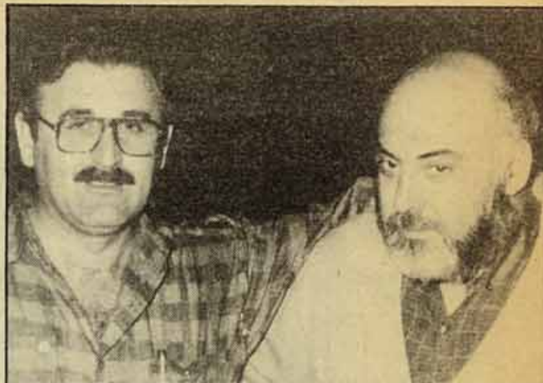
...i Diosdado i Montero.

El IV Congrés de la CONC, que va realitzar-se 20 dies abans del Confederal, va ser un avís. L'esquerra sindical vàrem treure el 12% dels vots i 5 membres a l'Executiva. Al Confederal, el PCE i el PCPE van fer tot el que estava a les seves mans, tal com també van fer al Congrés de la CONC, per a que no presentéssim cap llista alternativa. Van, fins i tot, comunicar a la premsa que havíem aconseguit presentar la llista gràcies a les signatures dels carrillistes. Això és fals. Si bé ens van signar 18 membres del sector PTE-UC, sense aquestes signatures també superàvem el 10% necessari per a presentar la nostra llista. Vam treure 71 vots, és a dir, 4 membres a l'executiva Confederal. Si recordem que