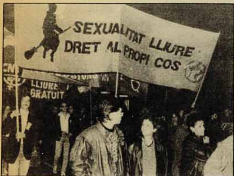
La resposta no es va fer esperar...