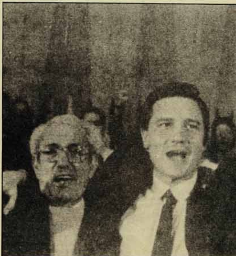
Camacho i Gutiérrez...