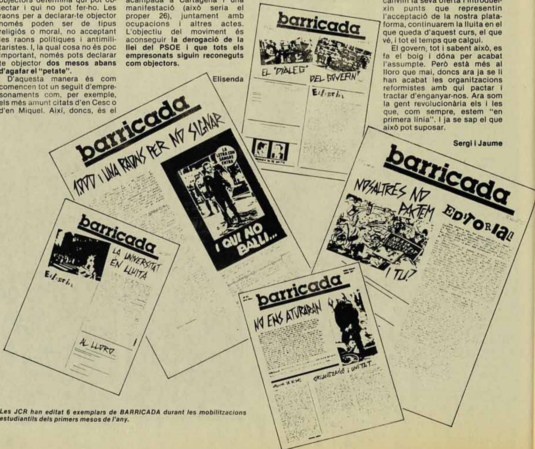
Les JCR han editat 6 exemplars de BARRICADA durant les mobilitzacions estudiantils dels primers mesos de l'any.