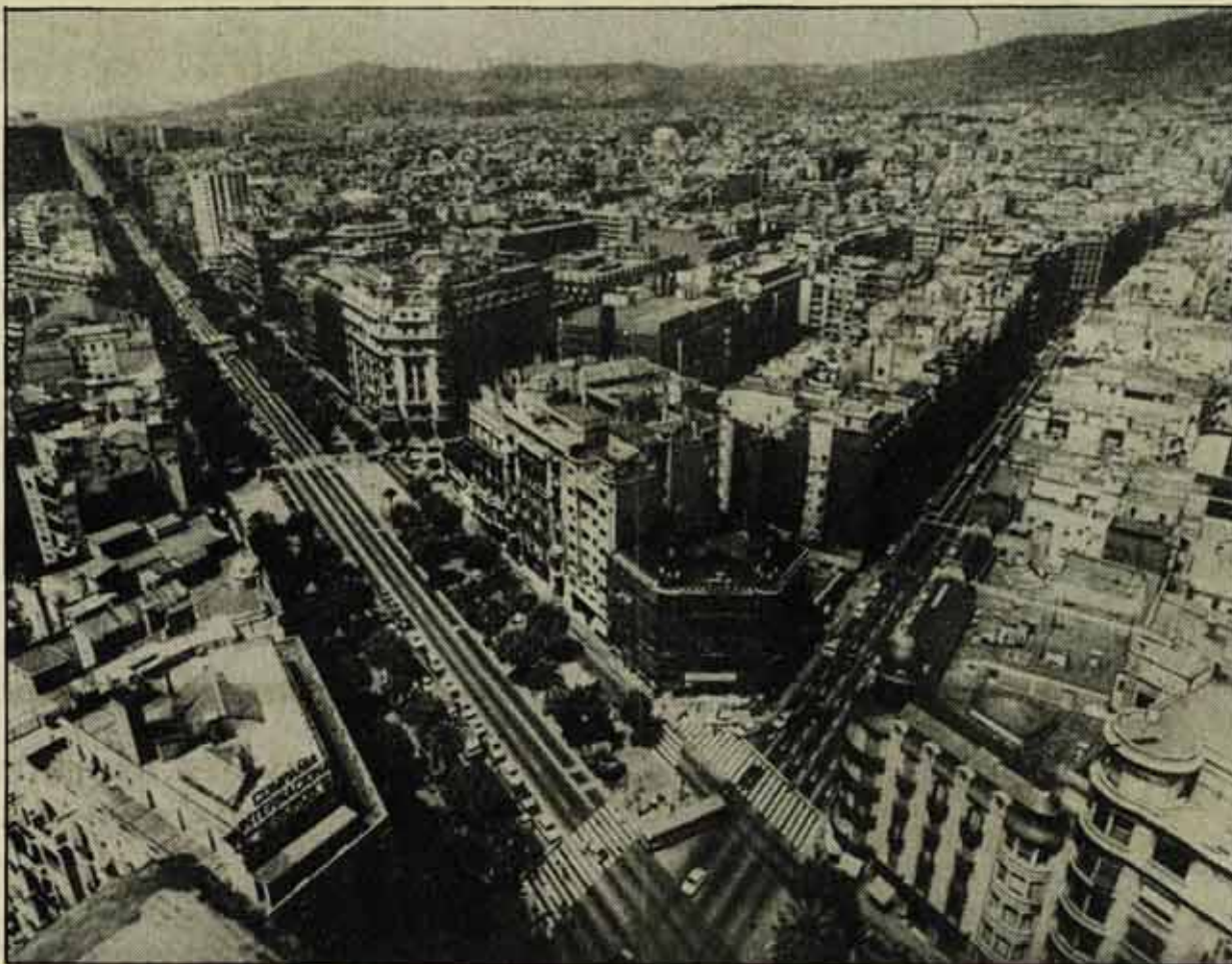
Barcelona: volen apartar al poble del seu centre urbà.