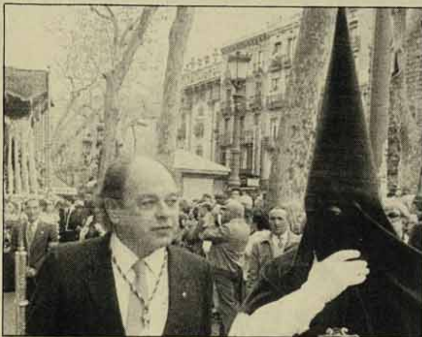
Adivina qui és el senyor Pujol.

Diu Felipe González que no sent "acosat", sinó com a molt