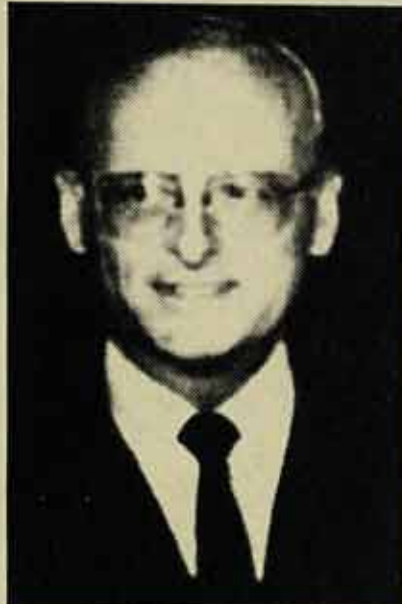
Carl Hahn, president de Volkswagen.

Respecte als continguts: s'accepta la implantació del torn de nit obligatori i general; la promoció dels especialistes a oficials de 3ª (vella reivindicació de la classe obrera de Seat) resta condicionada a una revisió general de temps i, per tant, a un augment de la productivitat basat en l'enduriment dels ritmes de treball; s'amplia la jornada industrial. No està de més recordar que tots aquests elements s'enquadren dins de la filosofia de les 27 mesures d'en-