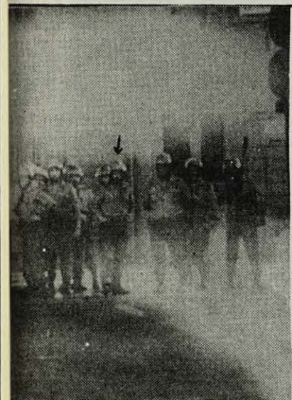
El policia assenyalat: "no hagués sortit de casa".

Integrada als seus orígens pel PSC, MCC, OEC, PSAN, LCR, JCR