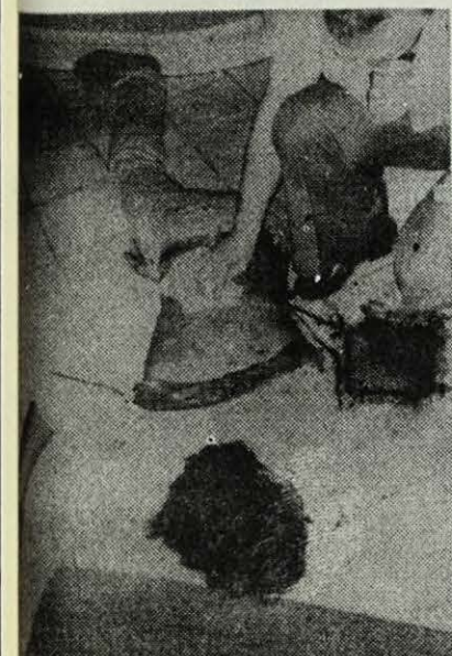
En Gustau a terra, el forat a l'esquena és típic d'entrada de bala.

2on) La policia no va fer absolutament res per ajudar el jove; la única resposta que varen rebre aquells que es dirigiren a la força pública demanant ajuda fou la continuació dels trets i una frase lacònica pronunciada pel policia assenyalat en la foto: "si se hubiese quedado en casa no le hubiese sucedido esto". Una descripció dels policies de paísà al·ludits en la nota de la Jefatura Superior, segons alguns testimonis, és la següent: "el que semblava el cap tenia uns 45 anys, de 1,85 ó 1,90 d'alçada, complexió atlètica però amb panxa. Vestia traje gris fosc, amb camisa blanca i corbata. Ca-