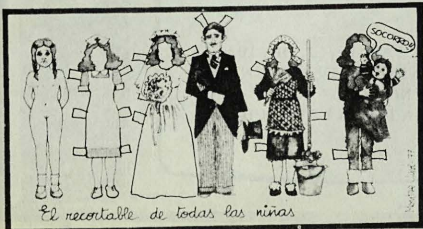
El recortable de todas las niñas

Las entidades abajo firmantes hacen constar su firme propósito de no ceder hasta conseguir sus objetivos, y con este fin han constituido un organismo unitario para coordinar sus actividades y hacen un llamamiento a todas las entidades aún