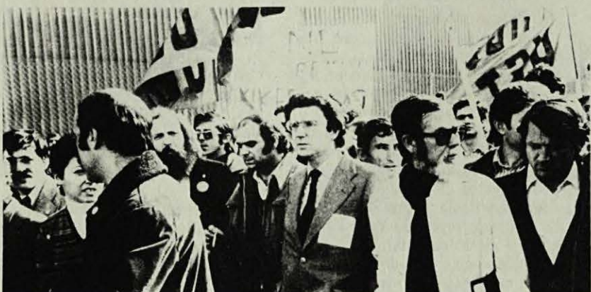
No van aconseguir aturar la regulació

El mateix dia anterior a les vacances de Setmana Santa, era concedida la regulació de treball encara que reduïda de 24 a 16 dies. Així l'empresa i l'administració implicada evitaven una possible resposta per part dels treballadors.