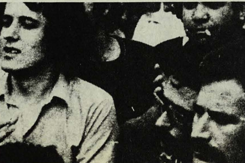
"... el màxim control de tots els treballadors sobre la negociació"