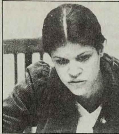
Dolores: dificultats al debat democràtic.

MANUEL MARTINEZ: Efectivament, la problemàtica dels drets nacionals de Catalunya fou tractada al Congrés, tocant-se el tema de la Generalitat i l'autodeterminació. Tots coincidim a l'afirmar que l'actual Generalitat no es correspon amb la voluntat del poble català expressats el 15 de juny, i al carrer l'onze de setembre. Però diferents sectors, treient les conclusions d'això, calia rebutjar aquesta "Generalitat", i plantejava com alternativa que la UGT de Catalunya es pronunciés per la convocatòria