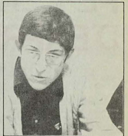
Navarro: els treballadors no tenen cap responsabilitat en la crisi.

inmediata d'Eleccions al Parlament de Catalunya i que el Consell Executiu estigués format pels partits majoritaris (PSC-PSOE i PSUC) segons la voluntat popular. La majoria, al contrari, no es pronunciava respecte a aquest punt.