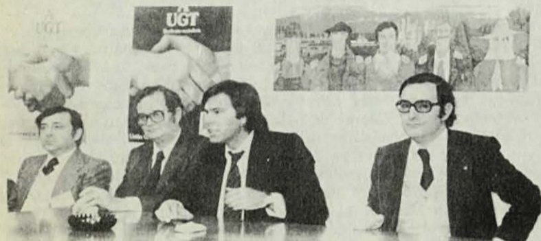
Majoria obrera als ajuntaments...o bipartidisme?

(1) A Biscaia participen ANV, HASI, LKI (LCR), OCE-BR, PCE, PSP, LAIA, ESB i el moviment de batlles de Vergara.