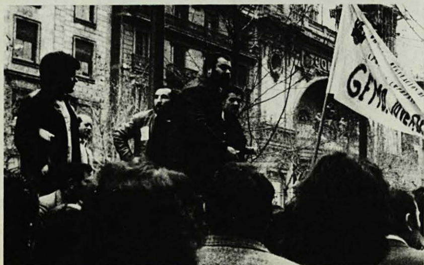
— Tenen moltes coses a dir, en la lluita contra la crisi.