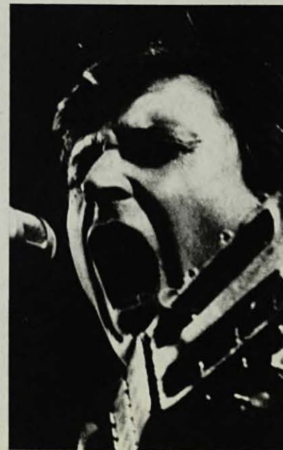
— "Quan creus que s'acaba... torna a començar!"

El diumenge hi hagué també un gran acte de solidaritat a la Catalunya Nord, el qual va anar precedit, el dissabte, d'una assemblea a l'Aula Magna de la Universitat de Perpinyà