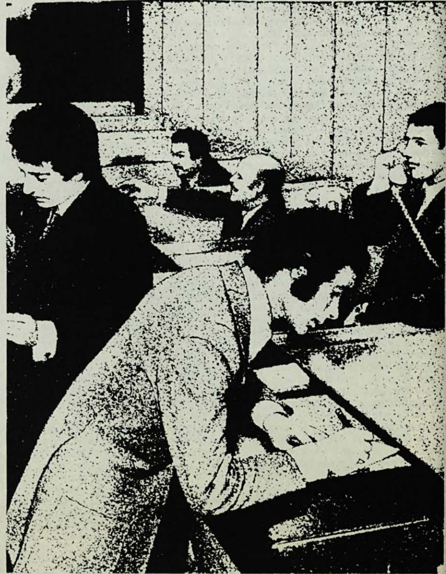
— A un costat i a l'altre de la "finestreta": treballadors. Qui s'aprofita dels seus estalvis?