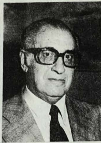
Pere Pi i Sunyer

El que no es tant conegut es el que els va respondre: els va dir, textualment, que no els hi podia donar ni tant sols un recolçament moral, que es limitaria a escoltar-los i després veuria el que li deia el MEC, doncs tenia d'escoltar a tothom. Es clar que la Generalitat actual, sense un duro i sense cap poder polític, poca cosa podia fer. Tanmateix, un Consell Executiu dels partits obrers podia haver facilitat l'organització i l'extensió de la lluita i, el que és més important, podria haver encarat la maniobra del MEC