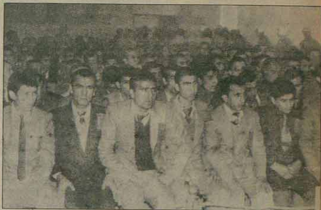
El fiscal militar turco ha pedido la pena de muerte para 126 miembros de la organización de izquierda Dev-Yol.

Más peticiones de penas de muerte para sindicalistas y militantes de izquierda