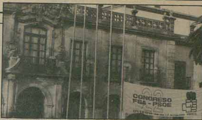
«El incomparable marco del Hotel de la Reconquista».

A pesar de las manifestaciones de Jesús Sanjurjo —“éste es un congreso bien discutido”— hay datos reveladores del nivel de debate. Las memorias (ponencias) aparecieron unos días antes de la inauguración, de manera que casi todos los delegados fueron elegidos antes de que las asambleas conocieran la totalidad de las mismas. Por otra parte, la Resolución Política fue aprobada con más de la mitad de los delegados fuera de la sala, entre ellos los portavoces y ejecutiva saliente, y los presentes no habían recibido