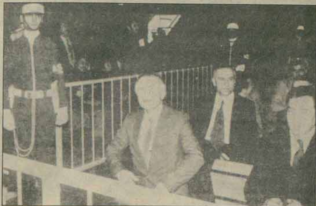
Proceso contra los sindicalistas de la DISK en Istanbul.