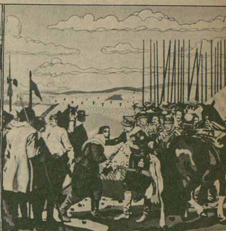
La rendición de Torrejón. 1971.