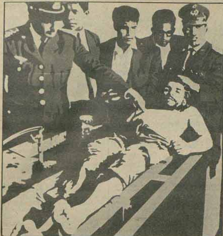
Los impactos. 1967-68.