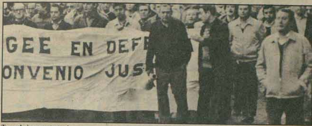
Tras el cierre patronal