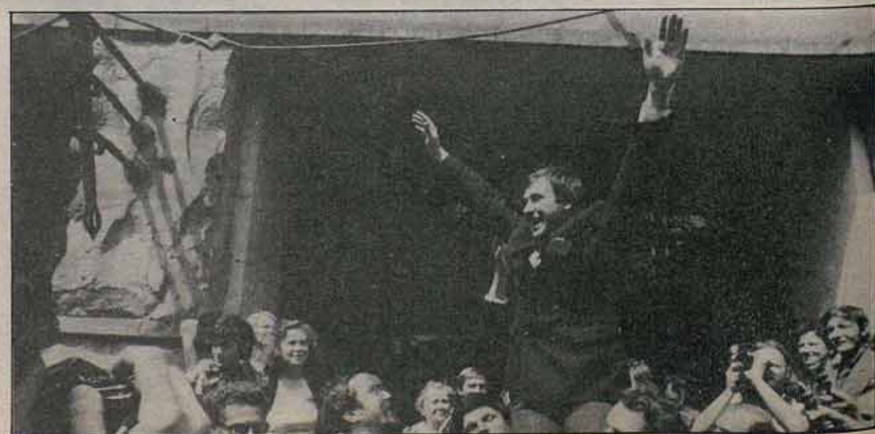
«Las leyes de la historia son más fuertes que los aparatos burocráticos», alguien lo dijo hace tiempo.

Por eso decimos que los hechos se imponen inexorablemente. Y es que las leyes de la historia son más fuertes que los aparatos burocráticos, como ya dijo alguien... y que las campañas del imperialismo