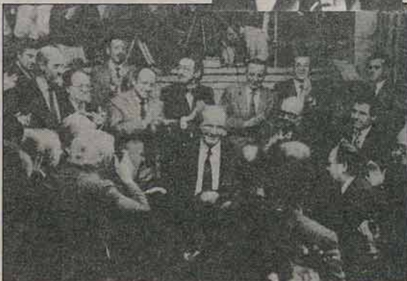
Esperando la decisión del presidente

por la derecha. Una inoperancia que incide sobre la crisis política de la propia Generalitat que comienza a ser algo así como un dato estable de la situación.