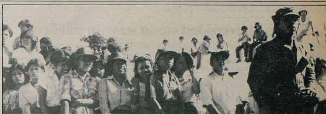
Declaraciones del Comandante Sandinista Bayardo Arce a su paso por Madrid

Hace falta que el poder de la población trabajadora expresado en el Día de la Solidaridad se convierta en un movimiento político, en un partido político de la clase obrera, independiente de los partidos de derechas “republicano” y “demócrata”, en una fuerza política que luche contra los recortes a las libertades, por la paz, por el pleno empleo, por los derechos de las mujeres, los negros, los latinos y las demás minorías oprimidas. ■