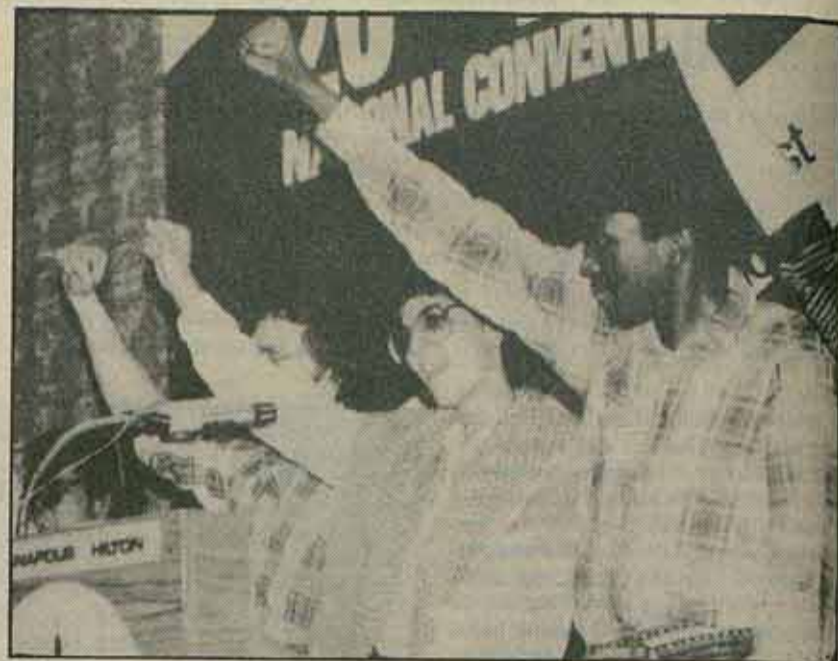
Mitin de solidaridad en USA.

Desde que el FMLN lanzó la ofensiva hace un mes, el movimiento de solidaridad ha ido creciendo a escala internacional, exigiendo el cese de la intervención yanqui y enfrentándose a gobiernos burgueses "democráticos" que, como el venezolano, prosiguen su ayuda a la Junta genocida. He aquí algunos ejemplos de las acciones que se desarrollan a escala mundial.