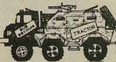
"Ayuda" yanqui al pueblo salvadoreño.

En Estados Unidos, el 11 de Enero se manifestaban 2500 personas en Washington exigiendo el cese de ayuda a la Junta. La iniciativa fue impulsada por el Comité de Solidaridad con El Salvador del que forman parte nuestros compañeros del SWP y varios grupos religiosos. El día 17 una manifestación de más de 3000 personas en Berkeley (California). Los trabajadores portuarios de la costa oeste continúan boicoteando los envíos de ayuda militar a la Junta.