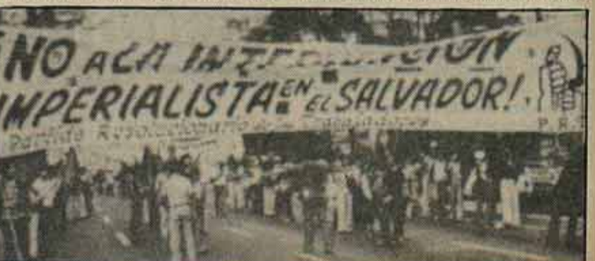
Manifestación en México.

En Portugal, está en marcha una campaña para recaudar fondos en favor de los familiares de las víctimas y de los refugiados salvadoreños y se ha difundido un manifiesto de solidaridad.