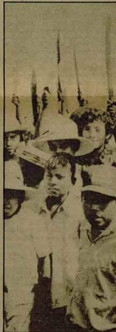
Cincuenta mil trabajadores de las fincas de caña y algodón del sur de Guatemala estuvieron en huelga desde finales de febrero a principios de marzo, en una impresionante muestra de unidad.

Los trabajadores del campo que habían ocupado fincas e ingenios tomaron medidas para protegerse. Organizaron comités de vigilancia para defender sus reuniones ante las provocaciones de las fuerzas del gobierno y