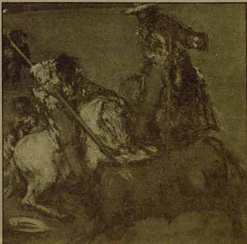
"Escena de toros" (fragmento). Goya fue otro más de los "brutos", "insensibles", a los que la lidia gustaba.

Sobre los argumentos de los horrorizados poco puede decirse. Desde luego