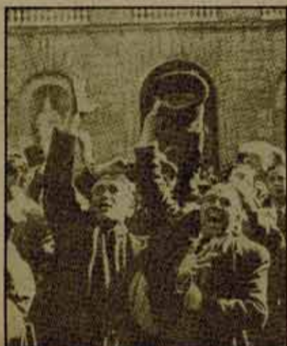
Febrero de 1936: plaza de San Jaime se anuncia la victoria del Frente Popular.

Lamentablemente la orientación seguida en las sesiones organizadas por la FIM no ha estado a la altura de esta declaración de intenciones y, menos aún, ha tratado de distanciarse de una historia edulcorada del PCE.