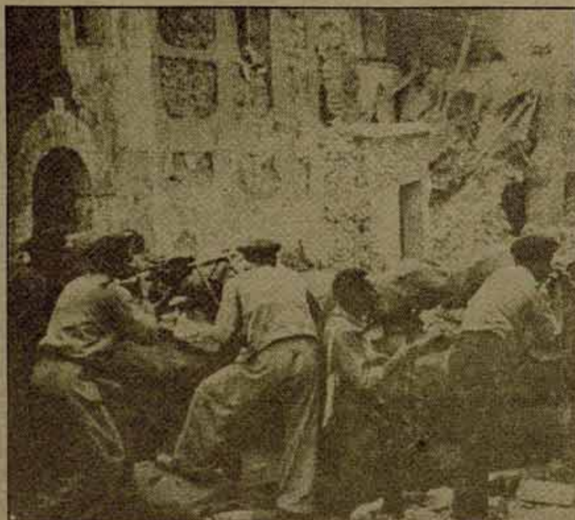
Milicianos al asalto de Belchite.

14 de abril de 1931: la proclamación de la República española es saludada por la dirección sectaria del PCE con el grito de "¡Abajo la República burguesa!", preconizando que la situación está madura para la revolución proletaria y la creación de soviets. Tales fueron las orientaciones aprobadas en 1930 por la "Conferencia de Pamplona". El PCE auspicia, en el plano sindical, la creación de un "Comité por la Reconstrucción de la CNT", un engendro sectario que impulsó a la Federación Catalano-Balear a escindir definitivamente del PCE para transformarse en el Bloc Obrer i Camperol. También la Agrupación Comunista de Madrid se autonomizó acercándose a las críticas que entonces formulara Trotsky contra el estalinismo y la burocratización en los PCs. El PCE quedó reducido a una pequeña secta de 200 militantes. Paradjicamente, el PCE pregonaba la revolución socialista en una situación democrático-burguesa como la de 1931, mientras que en una situación revolucionaria como la del 1936 hablaría de revolución democrática (!!!). No obstante, el entusiasmo