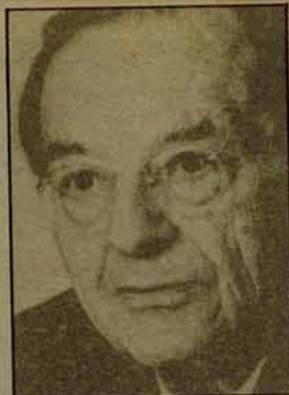
Erich Fromm, autor entre otros de un libro tan conocido como "El miedo a la libertad", falleció recientemente, el 18 de marzo, en Suiza.

Más tarde, a partir de su estancia en América, Erich Fromm se "desviará" lamentablemente de sus primeras concepciones teóricas, evolucionando hacia posiciones que desradicalizarían, cada vez más, las teorías freudia-