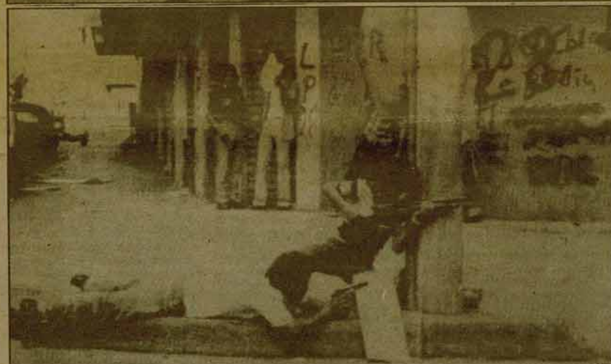
La continuada política de masacre que la Junta derechista salvadoreña lleva a cabo, comienza a ser respondida cada vez más ampliamente por los trabajadores de aquel país. El armamento generalizado del pueblo y la coordinación de los diferentes frentes armados de las fuerzas obreras están hoy ya a la orden del día. La solidaridad internacional también.