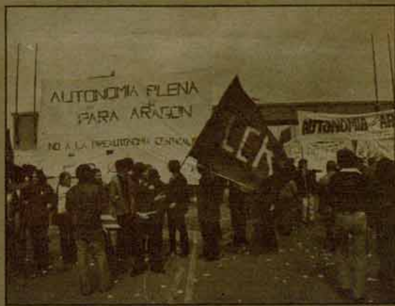
El día 23 de abril se celebrará una gran manifestación unitaria por la autonomía plena. La convocan en Zaragoza, PSOE, PCE y la Asamblea Autonomista (LCR, MCA, PTA y PSAI).