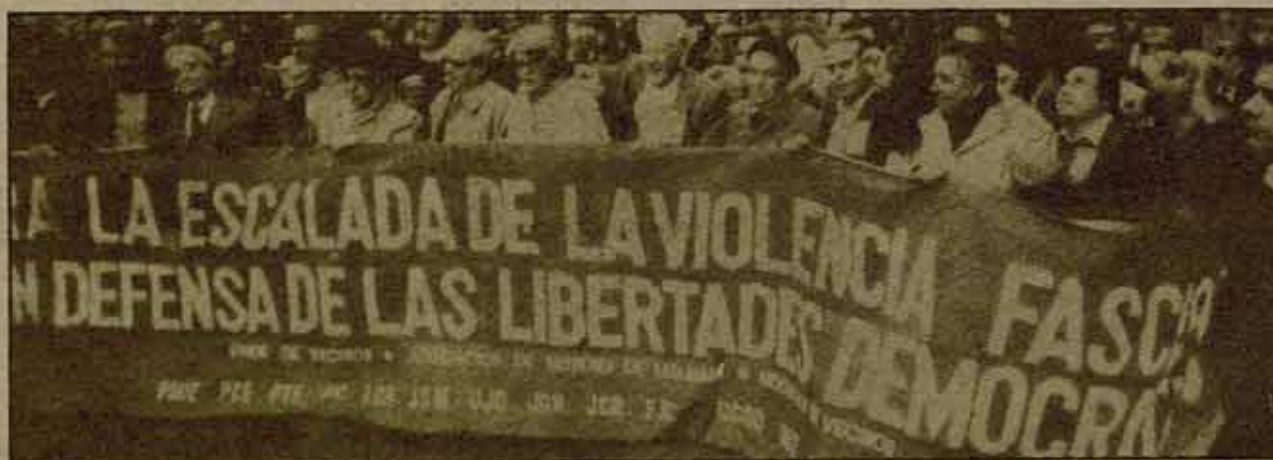
El ejemplo unitario de la manifestación antifascista celebrada en Madrid hay que extenderlo y concretarlo en los barrios.

la unidad de la izquierda y de las asociaciones populares. Así convocamos a las fuerzas, que una vez más acuden inmediatamente a la mesa aportando sus iniciativas. La presencia del PCE, PSOE, JJSS, UJC, Ateneos Libertarios, LCR y asociación de vecinos y escuelas populares, colectivo ecologista, es el primer paso hacia lo que definitivamente la LCR quiere construir: un comité estable de lucha antifascista.