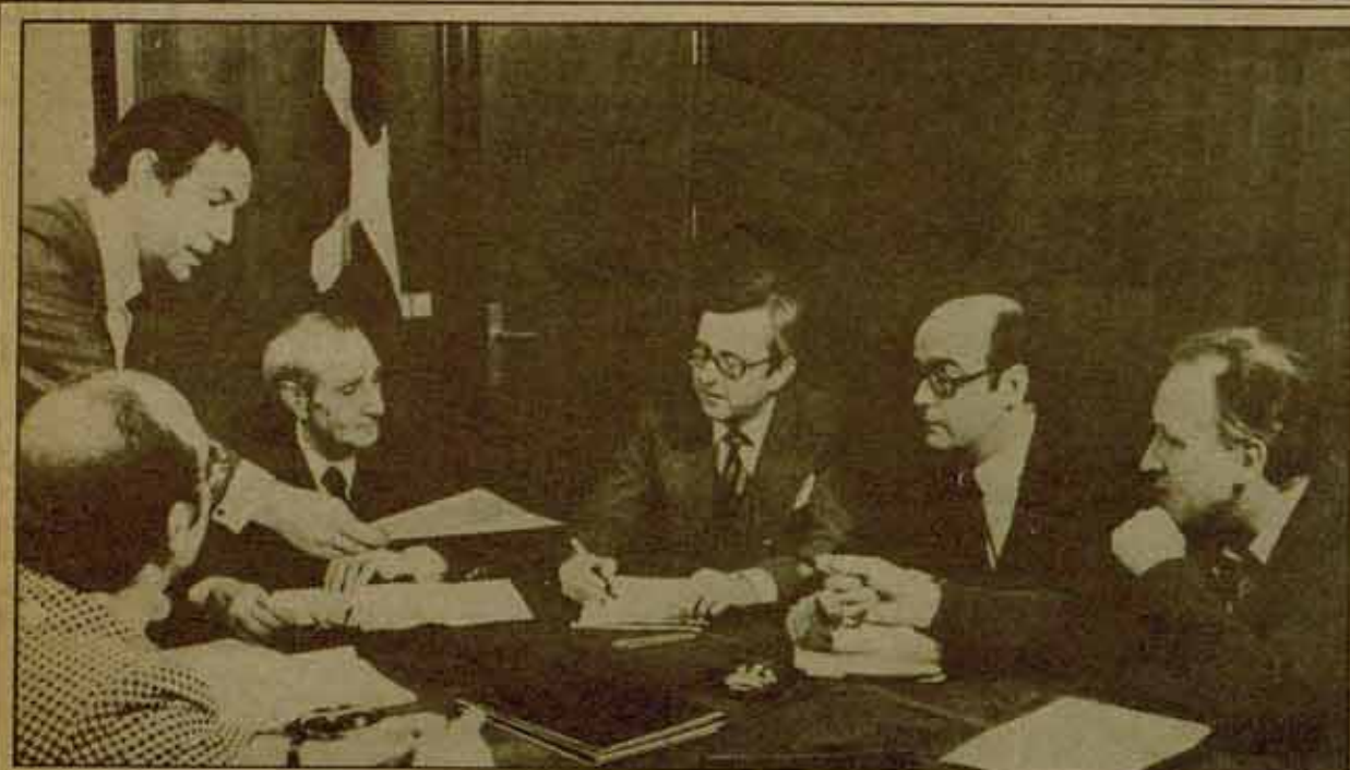
El PNV gobernará en solitario