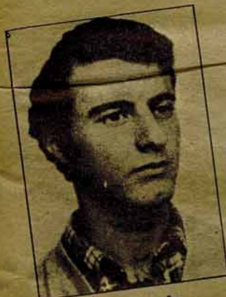
Lerdo de Tejada ¡SE BUSCA! Uno de los implicados en la matanza de "Atocha". Su juicio se celebra el día 18. MILITANTE DE FUERZA NUEVA