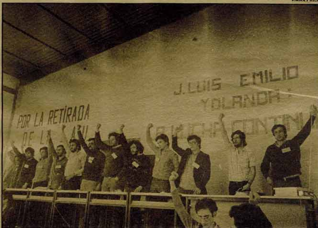
Un momento de la reunión de la Coordinadora celebrada en Madrid. Se guarda un minuto de silencio por los compañeros asesinados.