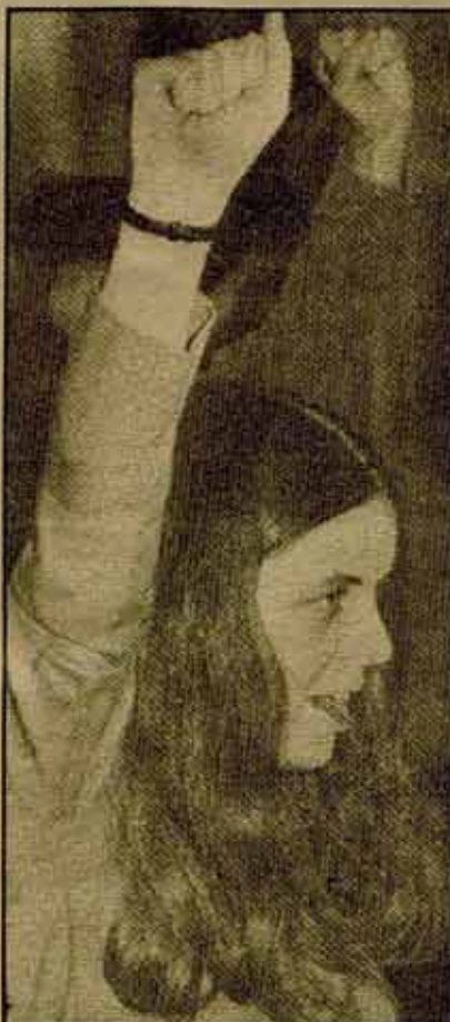
Bernardette Devlin, en su época de diputado del Parlamento británico.

El Gobierno ha conseguido separar en estas elecciones a Navarra del resto de Euskadi. Los troskistas vascos de Navarra y del resto de Euskadi van a trabajar unidos en una misma campaña. Con un ambicioso plan de trabajo, los compañeros navarros van a llevar al mayor número de barrios, fábricas y pueblos la