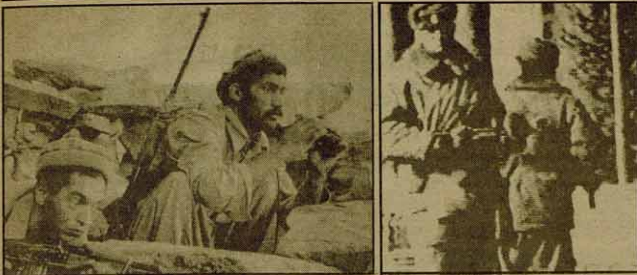
Guerrilleros musulmanes afganos se enfrentan con el ejército soviético. En la foto de la derecha, soldados soviéticos patrullando por las calles de Kabul durante estos días.