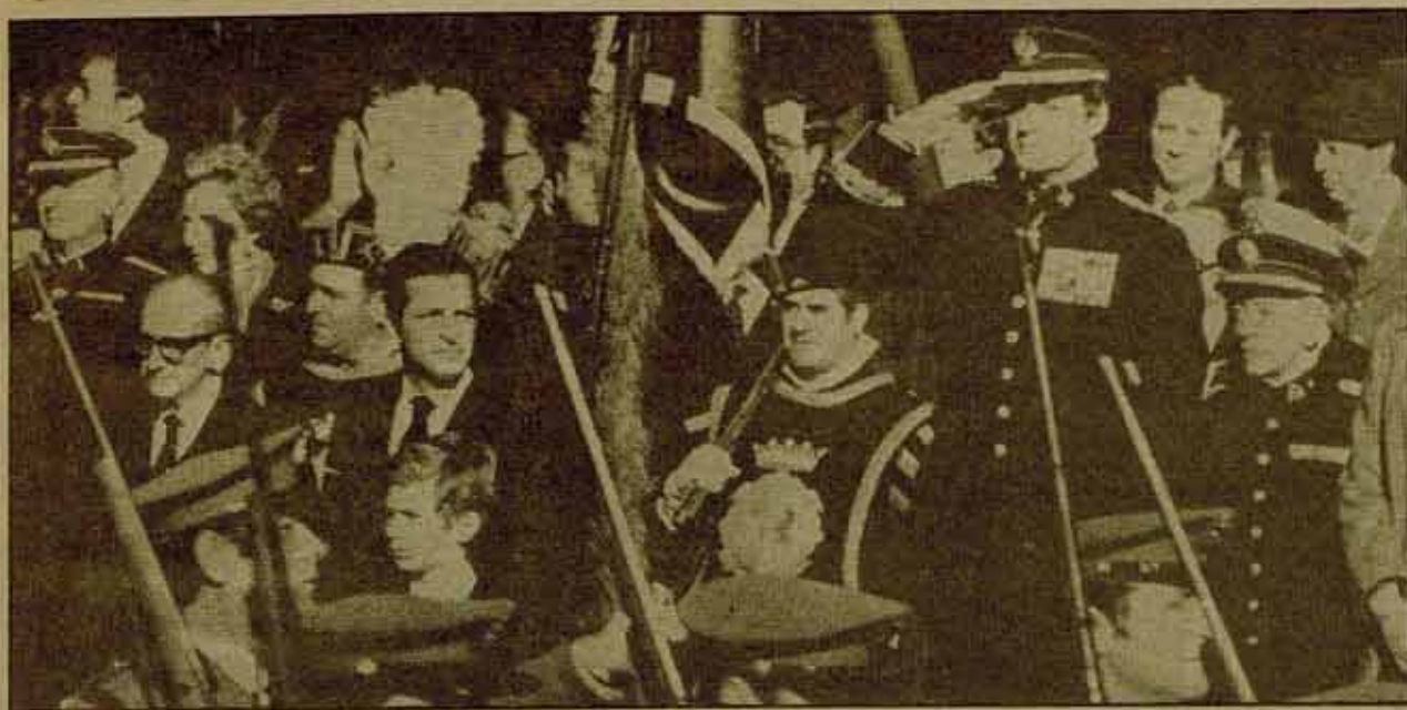
Monarquía. Ejército. Sociedad