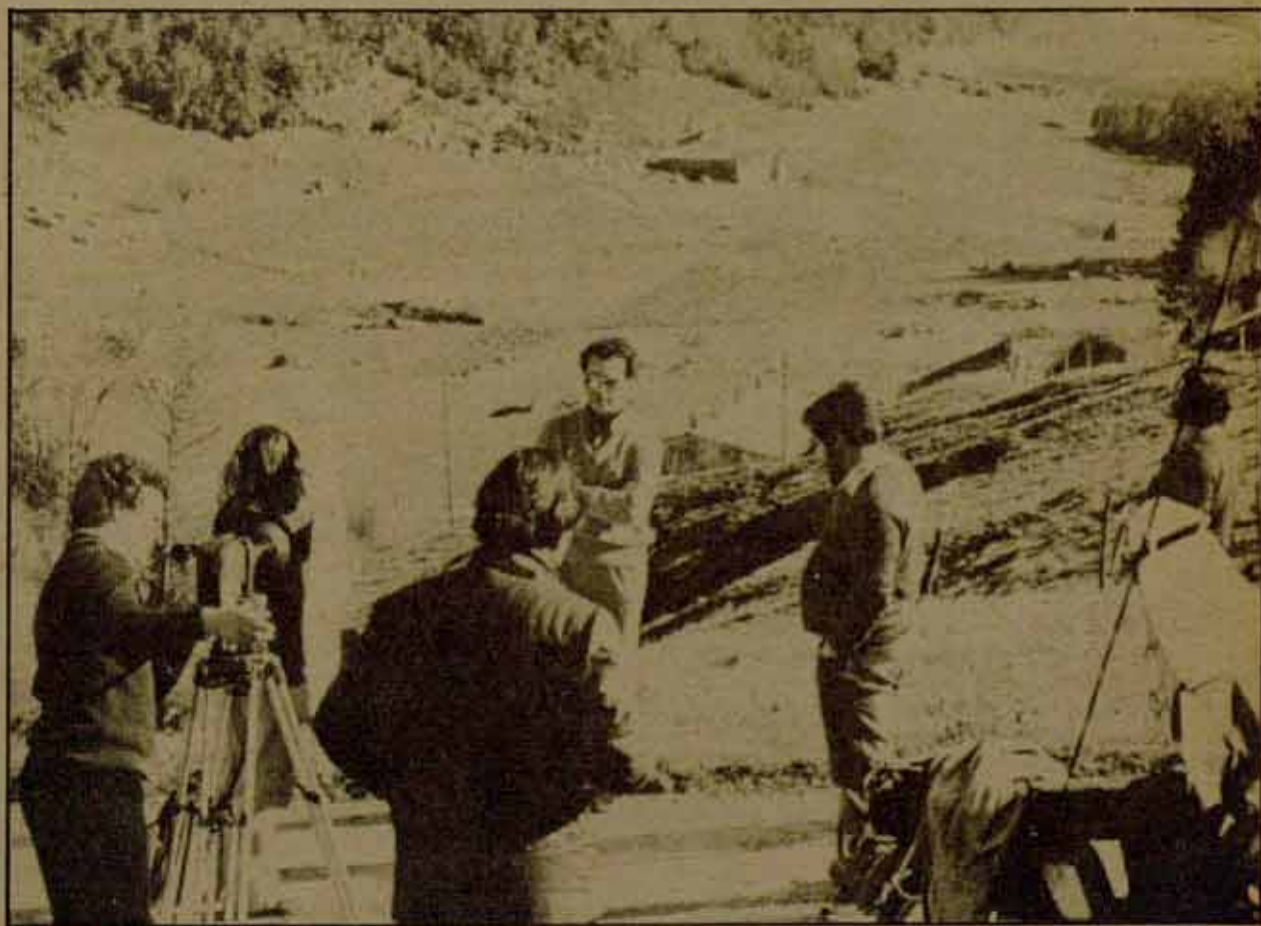
“El Proceso de Burgos” (foto de rodaje) de Imanol Uribe. Film mayoritariamente votado por el público en Benalmádena 79.

Tal proyecto debe contar, evidentemente, con el apoyo económico efectivo —no sólo verbal— de la corporación municipal y de los partidos de izquierda. Para lo cual sería necesario que dichos partidos se decidieran a elaborar una política cultural coherente que fuera más allá de voluntarismos bienintencionados y obsoletas concepciones populistas que, como se ha visto en la edición que ahora concluye de la Semana, también son esgrimibles por la derecha más cerril y empecinada. Sólo así podrán evitarse los inconvenientes de una gestión excesivamente personalista —centrada en la figura de Diamante— y que Benalmádena claudique de su luchadora tradición democrática, convirtiéndose en ese Festival ad usum delphini (léase: multinacional y mundano) al que la burguesía local fuese a lucir smokings, trajes de noche y perifollos varios.