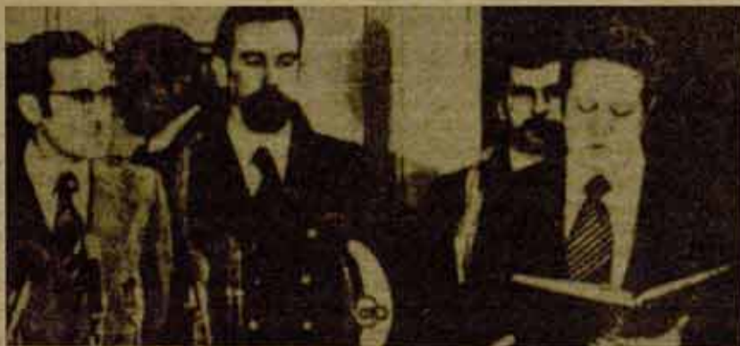
Mario Soares presta juramento: un socialdemócrata fiel al capitalismo

“Reforzar la austeridad para sacar a Portugal de la crisis económica”. “Poner entre paréntesis el socialismo”: al parecer para salvar la democracia: Mario Soares no se ha andado con pelos en la lengua. El discurso del dirigente socialista ante la Asamblea de la República, para presentar los grandes apartados del programa del nuevo Gobierno, formado por el P.S. y del C.D.S., no ha venido precisamente a confirmar las tesis de quienes hace poco aún afirmaban que Soares había “salvado al socialismo” en Portugal.