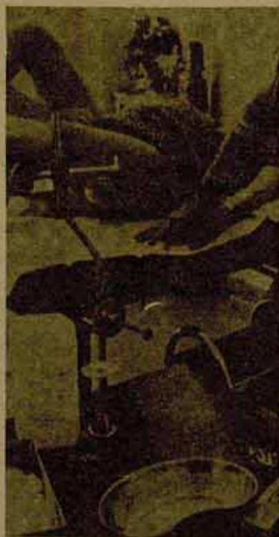
"Derecho al aborto"

— El reforzamiento de los sistemas represivos, y su cooperación internacional hace que cada una de nosotras esté amenazada.