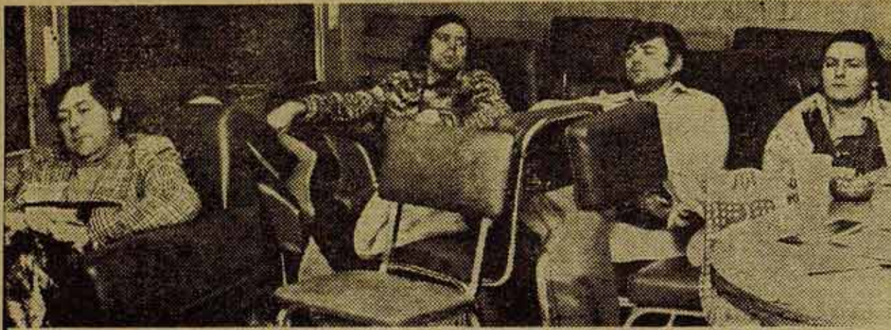
Solidaridad con los despedidos, de la huelga de hambre a la huelga general