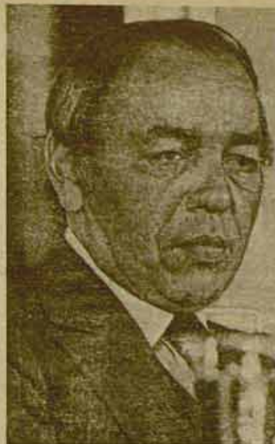
Hassán II, el verdadero ganador

No cabe duda que si tanto socialistas como comunistas pusieron tanto empeño como el que pusieron respecto a este Acuerdo pesquero, en lo que a libertades democráticas y desmantelamiento de instituciones franquistas se refiere, este país sería otra cosa. Pero dejemos el tema y volvamos al debate.