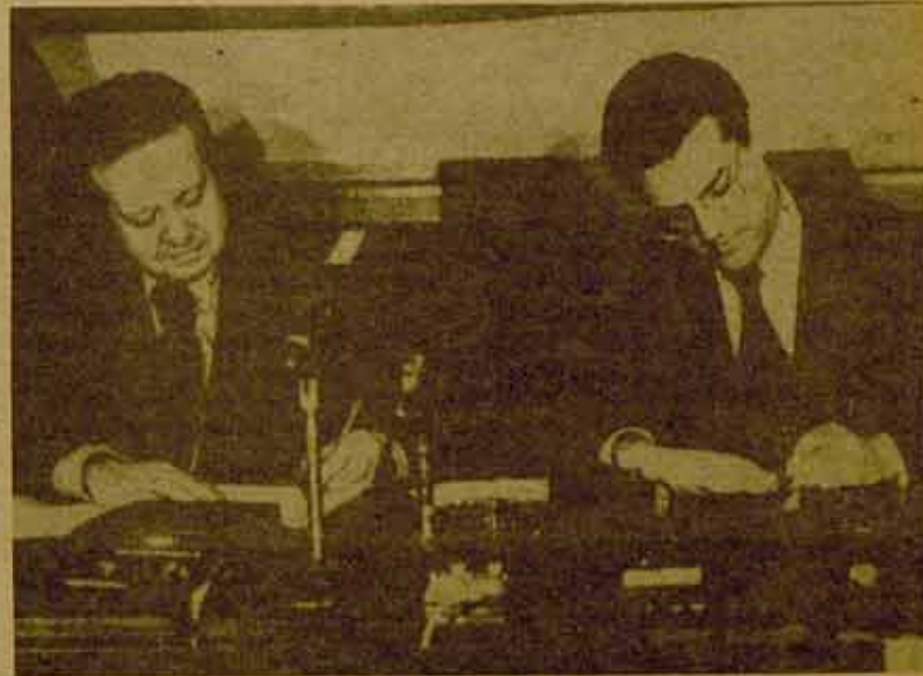
Firma del acuerdo P.S.-C.D.S.

El intento de Soares de llegar a un acuerdo con el P.C., al mismo tiempo que aliarse al C.D.S. para formar gobierno, ha fracasado: la incompatibilidad entre ambos objetivos estaba clara cuando se ha sabido que dos días después de la lectura del programa del nuevo gobierno ante la Asamblea de la República, se reunirá el consejo general de la Intersindical para discutir las formas de lucha contra el gobierno P.S.-C.D.S.