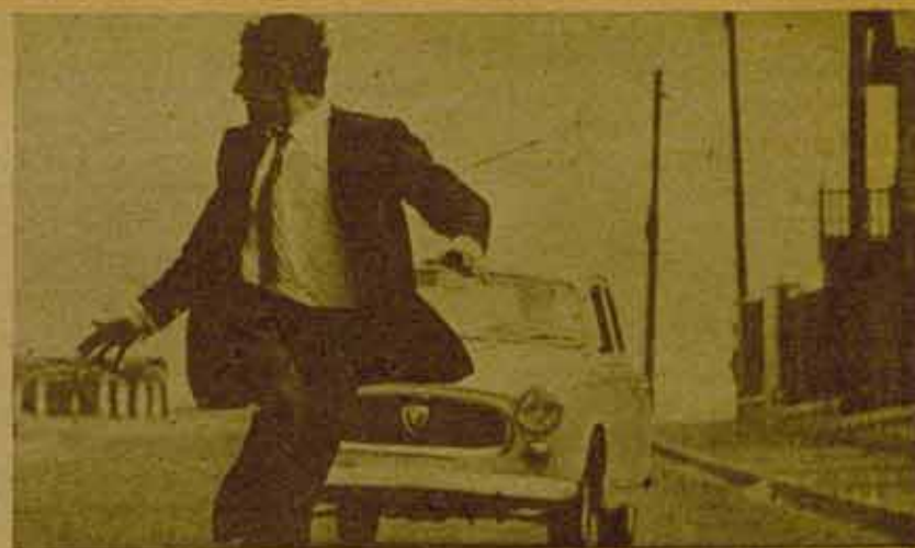
"Z", una película eficaz y, desgraciadamente, actual.