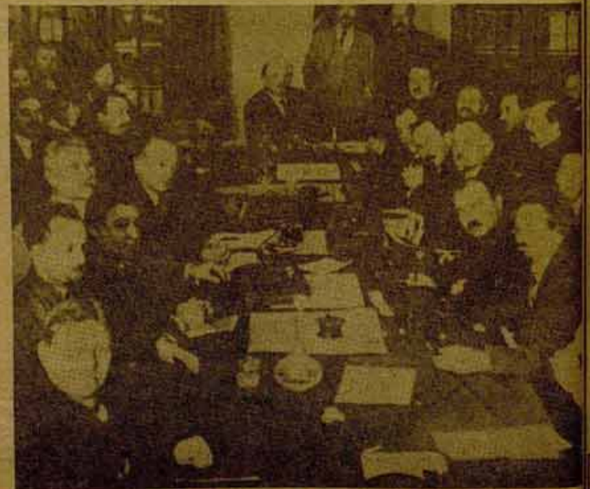
Octubre 1922 / Consejo de Comisarios del Pueblo