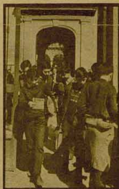
Enseñantes en paro y niños sin escuelas

Concluyen su documento valorando que "lo hecho hasta ahora parte del esfuerzo de un pequeño grupo al que se ha ido sumando cada día más gente. Pensamos que hay pasos ya