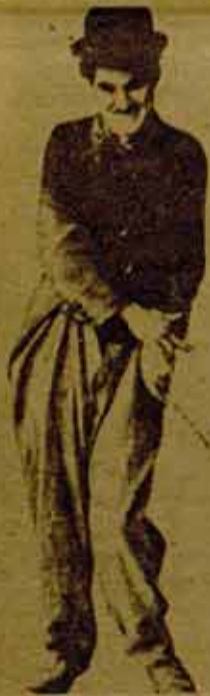
Este pobre pequeño ser

"¿Qué es lo que evoca mi nombre en el espíritu del hombre de la calle? Una pequeña figura patética, mal vestida, un sombrero bombín abollado, un pantalón ancho, grandes zapatos y un bastón pretencioso.