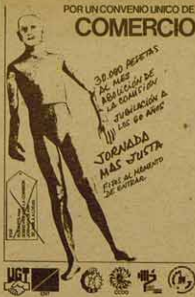
La unidad de los sindicatos duró poco

Acabada la huelga, queda en pie el problema del Convenio Único. En la misma lucha se decidió mantener una Comisión Negociadora y se llamó a la participación unitaria de todas las centrales en ella. Pero con la