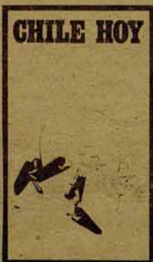
Hubo un salto cualitativo enorme debido a la realidad de la lucha de clases