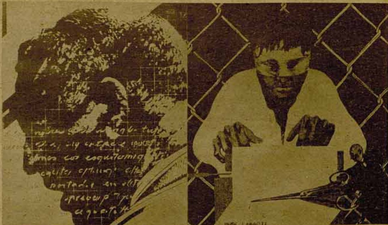
La represión en el estado militar o el miedo a la cultura

Como director cinematográfico ha realizado "La espiral", riguroso análisis filmico de la experiencia de la Unidad Popular y de la estrategia contrarrevolucionaria de la burguesía chilena y del imperalismo americano. Al margen de la Universidad, Mattelart desarrolla sus investigaciones sobre la ideología militar, tratando de tipificar las alianzas de clase y el modelo de desarrollo económico que caracteriza al Estado militar. Continúa además sus trabajos sobre la lucha ideológica y sobre lo que el mismo denomina el "modo de producción de la comunicación capitalista".