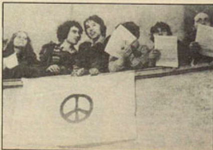
Grupo de "Verdes" en el Bundestag

Otro de los planteamientos básicos de los alternativos es no reconocer fronteras y actuamos siempre que queremos en donde queremos. Para nosotros los derechos humanos no pueden pasarse por el tamiz de cada ideología: