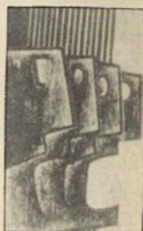
Un trabajo importante

Es una tarea fundamental de la izquierda sindical continuar en los próximos meses la lucha por la convocatoria de la Jornada, hasta lograrla imponer.