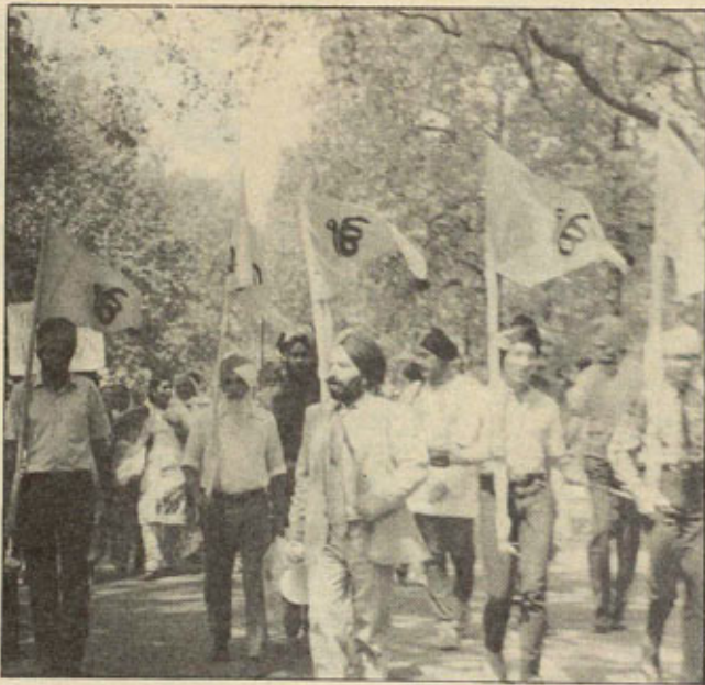
Datos recopilados por Angel Valcarcel

Las consecuencias futuras de la crisis, el reajuste de poder entre las fracciones políticas dominantes y la salida política concreta al "affaire" Sikh son imprevisibles, pero la violencia desatada por la miseria religiosa y la venganza "chauvinista" no son más que otro capítulo en la historia de la India, en la que todo se cuenta por cientos, por miles, hasta los muertos. En efecto, en los tres últimos lustros el país ha sido escenario de sangrientas revueltas en las que miles de personas perdieron sus vidas, sus casas o sus pertenencias; por miles se cuentan también los heridos o los que han perdido sus trabajos y todo ello bajo el signo de las luchas fratricidas por el color de la piel o las creencias religiosas, esto es, en el marco del "comunalismo" (1). El siguiente artículo —del que esta semana ofrecemos una primera parte— está basado en textos realizados por la Organización Comunista Revolucionaria (Inqalabi Communist Sanghathana), sección india de la Cuarta Internacional.