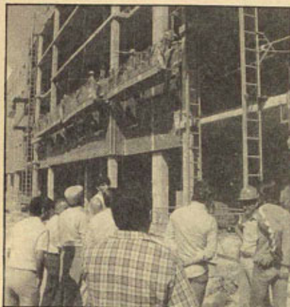
EN EL SECTOR 3 DE GETAFE: