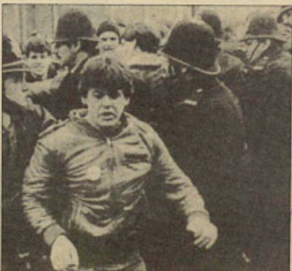
Decenas de miles de policías han sido desplazados a las principales cuencas mineras para reprimir a los huelguistas.

Parte del camino para conseguir que el conflicto se extienda está recorrido, si tenemos en cuenta las extraordinarias pruebas de solidaridad que los mineros han recibido y están recibiendo. La más reciente es la huelga de estibadores que puede afectar a la mayoría de los puertos de Gran Bretaña. Junto al apoyo económico de la gente, hay que señalar el desarrollo masivo de la lucha de las mujeres de los mineros y del movimiento feminista. La campaña de solidaridad de las mujeres —recogiendo muchas de las experiencias de la lucha de Greenham Common— ha sido determinante y tuvo su