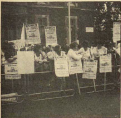
Las mujeres de los mineros y de los grupos feministas han tenido una participación destacada y activa.