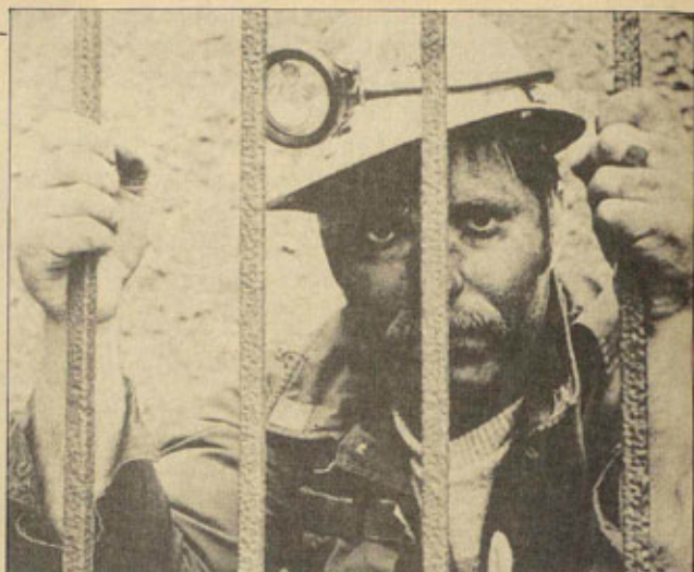
Los piquetes volantes del NUM (sindicato de los mineros) son masivos y constituyen una pieza clave del éxito de la huelga y la extensión de la solidaridad.

gobierno Thatcher no puede permitirse perder la batalla contra los mineros, ni siquiera bajo la forma de un compromiso. Las negociaciones entre el NBC y el NUM están paralizadas y parece difícil llegar a un acuerdo. Arthur Scargill, presidente del NUM, ha introducido entre los temas a negociar una subida salarial, reducción de la jornada laboral y, naturalmente, un no rotundo a que se cierre una mina o se despidan a un minero. Y, frente a las argumentaciones de Ian McGregor, presidente del NBC, sobre las minas "no rentables", Scargill responsabiliza al gobierno y a la patronal por no haber realizado las inversiones necesarias en su momento para asegurar su rentabilidad y explotación.