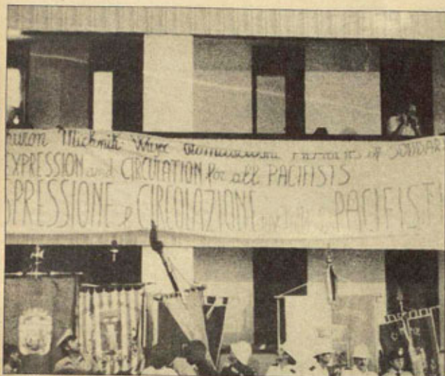
La ausencia forzada de los pacifistas independientes del Este pesaría como una losa sobre el diálogo en Perugia...

por las ausencias forzadas se expresó abiertamente en las sesiones de apertura y de clausura de la Convención. Desde luego, la ausencia de los amigos pacifistas este-europeos pesaría como una losa sobre el desarrollo del concepto clave en los debates de Perugia: el diálogo, el diálogo necesario, imprescindible, para aspirar a poder diseñar una "estrategia" de lucha por la paz.