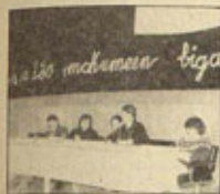
Mujeres de Euzkadi

Es precisamente en una sociedad violenta donde se hace más difícil, para quien la sufre, distinguir entre los distintos aspectos de la misma —sin simplificaciones ni esquematismos— y proponer alternativas para resistir y acabar con ella definitivamente. El movimiento feminista de Euzkadi discutió públicamente en las recientes Jornadas sobre la violencia. Han participado todas las mujeres, unas con escritos y posiciones, otras escuchando y opinando.