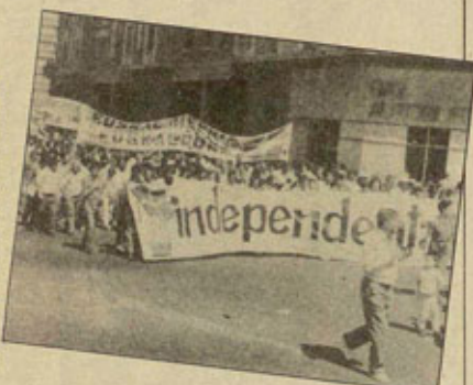
El significado de la manifestación de Iruña

En San Juan de Luz (Iparalde) se manifestaron más de 2000 personas.