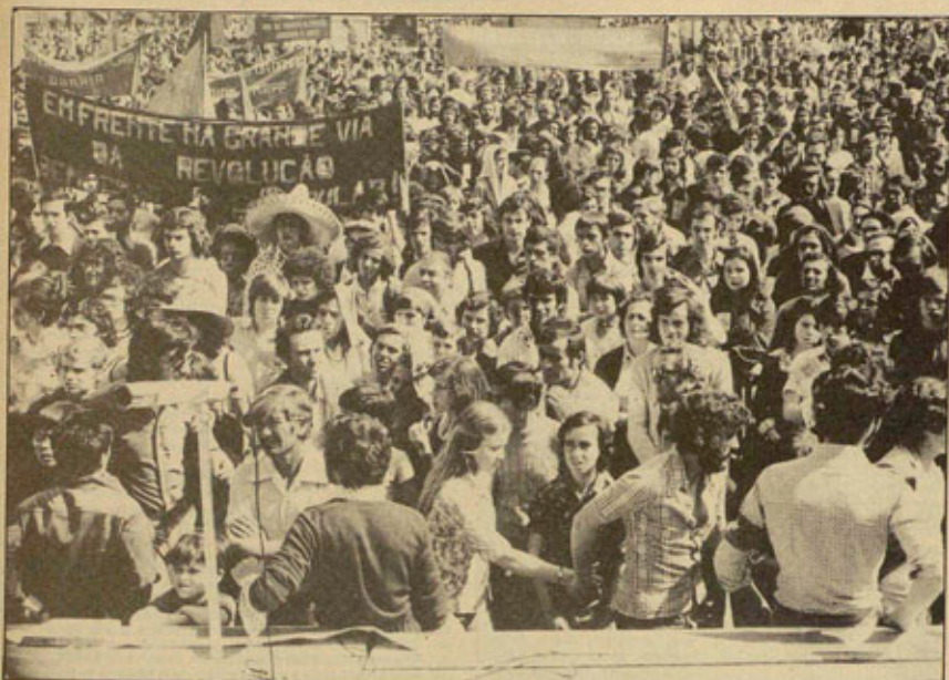
26 DE ABRIL DE 1974: REVOLUCION EN PORTUGAL