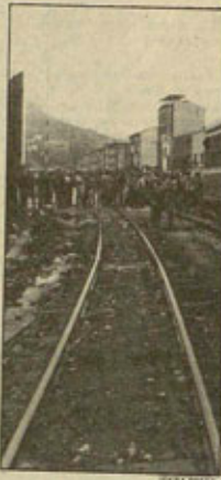
acuerdo con nadie a quien los mi-

"Punto nº 4. La empresa no puede llegar a la firma de ningún