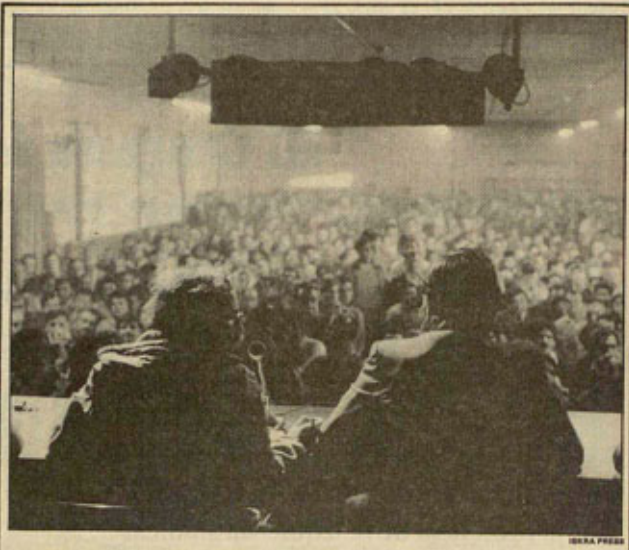
TERMINO LA HUELGA DEL METRO DE MADRID

Enfin, hay sindicalistas que trabajen en la producción, el mantenimiento, los servicios y el transporte de armas nucleares. Este es un potencial importante para frenar y llegar a detener y cerrar la industria de armamento nuclear. La conclusión general es que el movimiento obrero, junto a otras fuerzas sociales, tiene que desempeñar un papel muy importante en el CND.