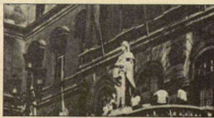
ADMINISTRACION LOCAL DE LA COMUNIDAD AUTONOMA VASCA