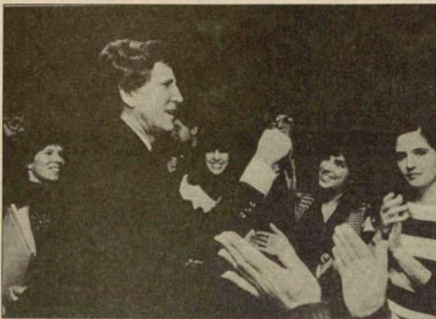
Si Gary Hart gana, dormiremos más tranquilos.

Candidatos negros, mujeres, chicanos, pobres, socialistas... los hay y los ha habido, pero gracias al hábil sistema de las elecciones primarias, filtro impenetrable para tales rarezas, nunca han alcanzado la "nominación" (eufemismo en lenguaje llano significa: nombramiento por la clase dominante o algunas de sus fracciones). Las batallas electorales entre los "nominados" son auténticas batallas campales —aísta quedan siempre toneladas de confetti, sobraitros, banderitas, globos, casacas de palma y las resonancias de los insultos y chistes malos—, pero al final todos los presidentes, republicanos o demócratas, han sabido encontrar el camino de Dios y demostrarle al mundo que los Estados Unidos saben defender su vocación universal. Unos emplean el dólar, otros la flota y el misil, otros la CIA y el complot; y en el plano doméstico, unos se alían con las multinacionales del petróleo y otros con las del acero, del automóvil o la banca, con los campesinos del Midwest o la industria militar de California y Florida, pero al final todos se las arreglan para que los pobres sigan empobreciéndose, los negros y chicanos en sus ghe-