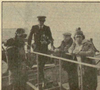
Los pescadores agorreados, en el puerto de L'Orion.