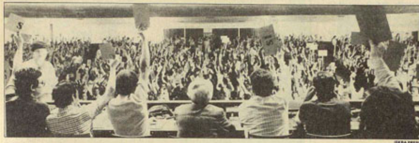
A PESAR DEL SECTARISMO Y DEL REGLAMENTO