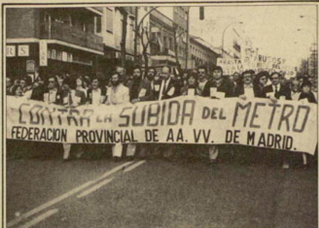
METRO DE MADRID

Es indudable que el resultado es un freno parcial a las aspiraciones de la patronal, pero en el conjunto del sector se comprende que tampoco recoge las reivindicaciones levantadas por los sindicatos. La escasa duración de la negociación - apenas un mes - ha impedido avanzar en la capacidad de la movilización, ni en aumentar la conciencia solidaria para poder responder a las reestructuraciones vendidas, al mismo tiempo que se ha agudizado la división entre UGT y CCOO. En definitiva, un mal balance, pero una buena experiencia que hemos de aprovechar en un futuro inmediato. □