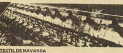
TEXTIL DE NAVARRA