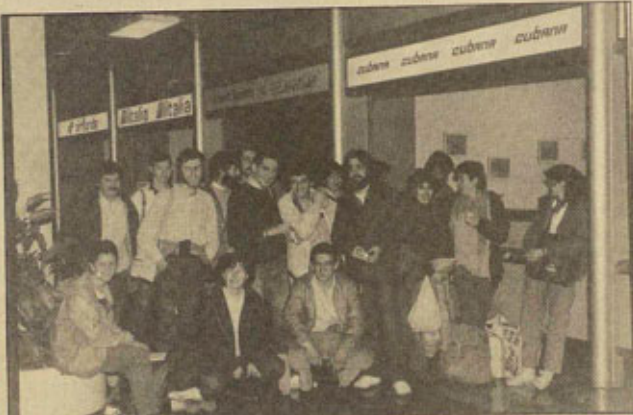
Un objetivo común: apoyar a los nicas.

En seguida nos mostraron, con gran orgullo, las cajas en las que llevaban cerca de 300 kilos de medicinas. Además, insistieron en que cada uno se llevaba sus herramientas de trabajo (por ahí se veían varias máquinas de escribir), menos el piloto de barco, claro. Este estaba muy tranquilo, con la sonrisa en la boca, aguardando todas las bromas que le hacían sus compañeros. En un momento dado, alguien le dijo que él era el único que tenía asegurado el puesto de trabajo: en el puerto de Corinto, donde se repiten los atentados de los contras, y