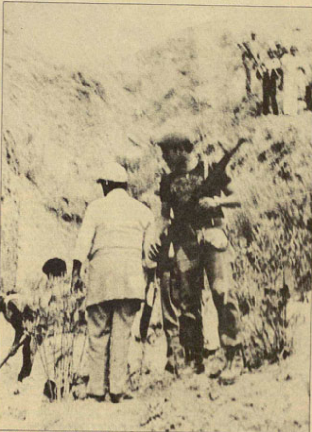
En esa noche, en esa quebrada, se llegó a los límites del horror.

Al atardecer, alguno que otro invitado estaba muy alegre y,