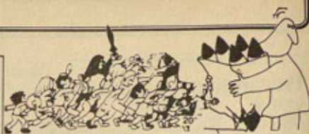
EN LAS INICIATIVAS DE PREPARACION DE LA IV MARCHA A TORREJÓN

Por otra parte es posible que el día 3 de Marzo se haga en bastantes lugares del Estado una entrega de los juzgados de autoinculpaciones de haber abortado o colaborado en la realización de abortos. □