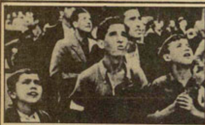
OTRA NOVELA SOBRE LA GUERRA CIVIL