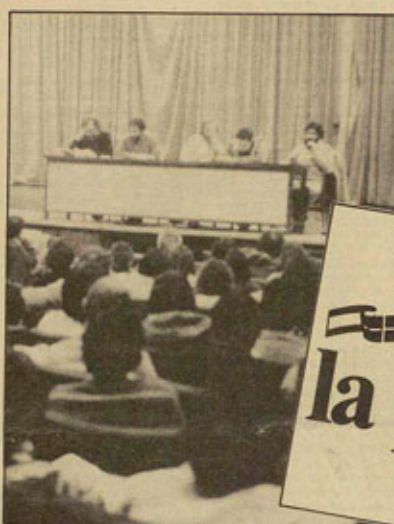
Presentación de Auzolan en Bilbao

AP se tiene que contentar en la Comunidad Autónoma con arrancar unos pocos votos entre las clases altas urbanas, en lo más rícano de la sociedad y en las propias instituciones estatales, desde cuarteles y cuarteles hasta sectores morales del funcionamiento. Su reivindicación del imperio patrio y de las salidas ultrarrepresivas choca ahora