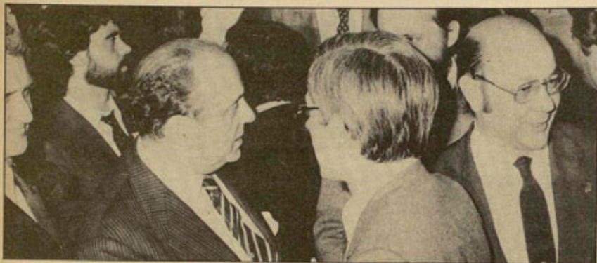
VII CONGRESO DE AP