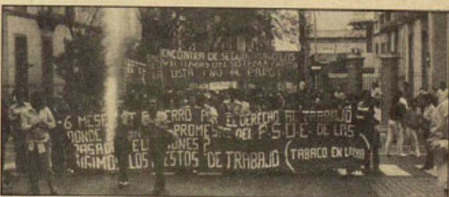
Manifestación de los trabajadores del tabaco ante el Gobierno canario.