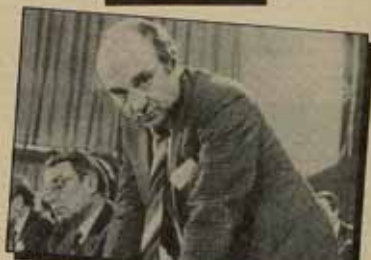
Carlos Lambadurff, ministro de economía de la RFA.