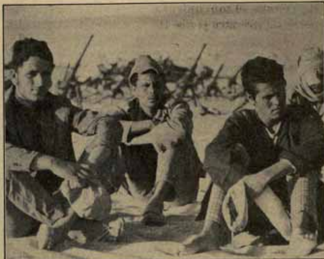
EL GOBIERNO NO RECONOCE AL POLISARIO COMO ÚNICO REPRESENTANTE DEL PUEBLO SAHARAUI.

Las últimas medidas económicas del gobierno no representan nada novedoso en la política "socialista": desde el momento en que se instaló en el poder, elevando las moderadas puestas electorales, se orientó a machacar a los trabajadores; si acaso, las nuevas subidas resaltan la implacabilidad con que el gobierno actúa. Por eso, la decepción gana comprensiblemente a capas más amplias de trabajadores, y cada día son más los que comprenden la gran estafa política que ha supuesto la victoria socialista. Pero por eso, también, cada día es más necesario movilizar a los trabajadores contra la política del gobierno socialista. □