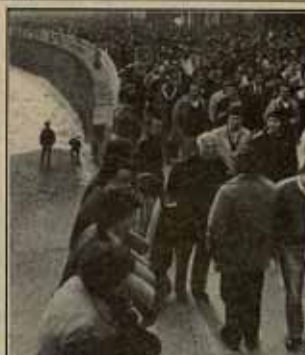
Secretaría Sindical de la LCR

El masivo movimiento de resistencia frente a la política de reconversión industrial del gobierno socialista es el dato más importante de la situación del movimiento obrero cuando se cumple el primer aniversario del gobierno de Felipe González. Este gran movimiento está aún lejos de poder desviar el curso decididamente favorable a los intereses capitalistas de la política gubernamental; el gobierno va a mantener sus objetivos económico-sociales (que suponen, uno a uno y en su conjunto, una agresión gravísima contra los trabajadores) envueltos, todo lo más, con mínimas concesiones a la UGT. La breve y modestísima época de las "promesas" de cambio, ha terminado ya. Esta situación está provocando contradicciones nuevas en las centrales sindicales mayoritarias, en las que tiene una trascendencia especial la situación dentro de CCOO. Así aparecen dificultades, pero también posibilidades importantes de trabajo para la izquierda sindical, que tiene ante sí la responsabilidad de pasar a formas superiores de actividad: ésta es la clave para que pueda iniciarse una verdadera recomposición con futuro del movimiento obrero en el Estado español.