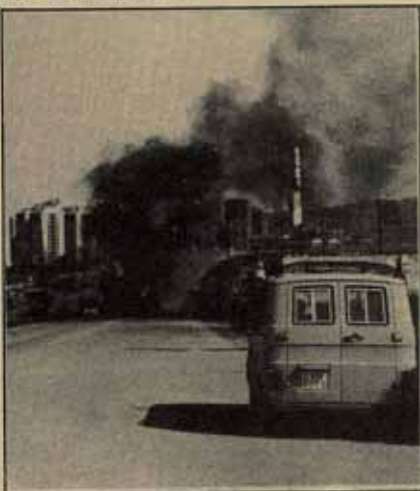
La imposible combatir al paro sin potenciar el sector público; ello plantea la necesidad de nacionalizar la banca, lo que choca frontalmente con el artículo 38 de la Constitución.

Los conflictos en los cuales la derecha se haya apoyado en la Constitución para combatir al gobierno, han sido pocos. El más reciente ha sido, sin duda, el recurso del grupo popular al Tribunal Constitucional por la expropiación de Rumasa. El decreto-ley del gobierno fue, en