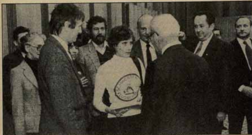
Petra Kelly, diputada "verde", hace entrega de la reproducción de una estatuilla donada hace tiempo por la URSS a la ONU. Actualmente es el símbolo de los pacifistas del Este.