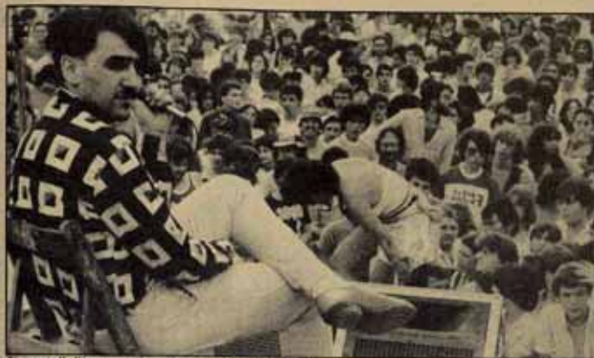
Guatemala. Ve Ya, provocación antirracista en un festival Anti-OTAN