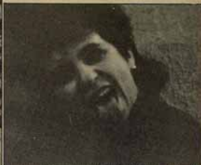
Miembro de Las Vulpas durante una entrevista con 'Combate'