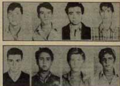
DÍA 17, AUDIENCIA PROVINCIAL, MADRID:

Pero si bien es cierto que esa es la única salida definitiva, también está claro que no es inmediata. Estamos lejos de poder imponer ya y acabar de manera definitiva con el peligro nuclear. En ese camino, el movimiento obrero debe y puede jugar un papel fundamental. Es imprescindible un movimiento masivo, potente, unitario, que impida al imperialismo dar nuevos pasos hacia adelante en esa carrera, que le impida instalar nuevos misiles en Europa, que le impida emprender nuevas agresiones contra los países que luchan por liberarse de su yugo. □