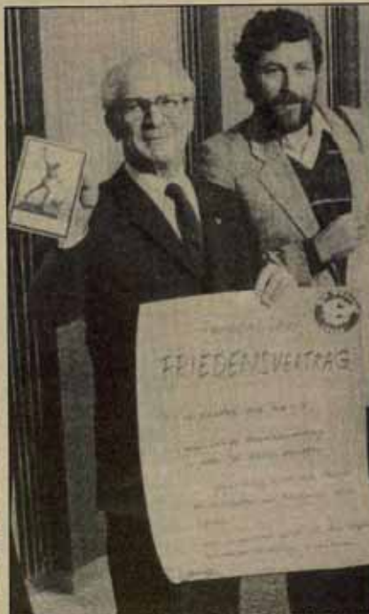
Erich Honecker, presidente del Consejo de Estado de la RDA y jefe del Partido Socialista Unificado de Alemania Oriental muestra el "tratado de paz" que le entregan los "verdes".

La propuesta de los verdes en el Kremlin plantea con toda su crudeza la cuestión del "equilibrio nuclear", pone en tela de juicio la misma estrategia soviética de responder a cada avance en el rearme del imperialismo con el rearme propio. Los burócratas del Kremlin, que por naturaleza desconfían de todo movimiento de masas que no esté bajo su control, que incluso lo temen — porque el hági monopolista del poder en su