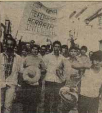
Los campesinos no pueden esperar nada del antiproyecto de Reforma Agraria presentado por la Junta de Andalucía. CCOO del Campo y el SOC no deben desentender la palabra Andalucía con las movilizaciones de este verano.

nomismo", el que los miles y miles de jornaleros sin tierra reclaman los miles y miles de hectáreas en manos de los terratenientes.