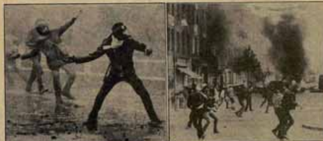
A por el cuartel yanqui de Bismarckstr.