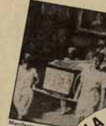
Manifestación en Alicante

ha impedido, también habrá hecho concentración ante el consulado yankee en Sevilla el miércoles 2 de noviembre.