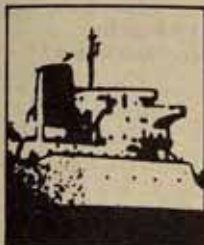
REUNION DE TRABAJO "CONSTRUCCION NAVAL" DE LA LCR