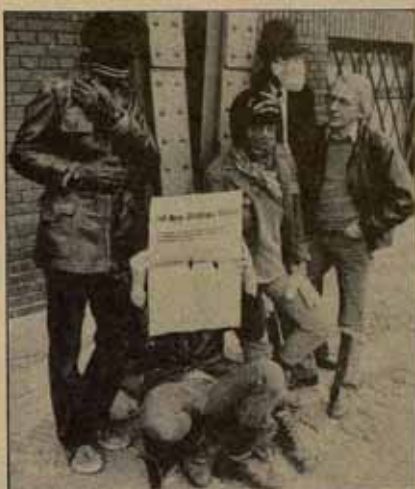
Los entrevistados se cubren por si acaso... El de la derecha es el periodista.