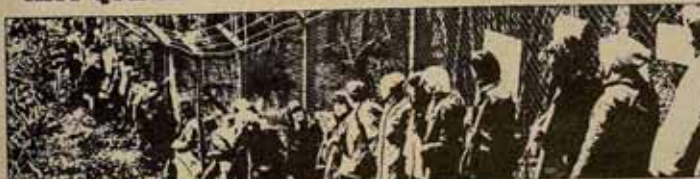
ENTREVISTA CON PACIFISTAS ALEMANES "AUTONOMOS", PARTIDARIOS DE LA "VIOLENCIA CALCULADA"