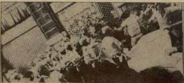
Auzolán se sitúa en el campo revolucionario.

LKI está participando activamente en la construcción de AUZOLAN junto con militantes de NI, de SUGARRA, con independientes que provienen de distintas corrientes. Queremos que EMK se incorpore plenamente. AUZOLAN debe ser una plataforma política donde los partidos y los distintos colectivos puedan funcionar abiertamente, donde se puedan incorporar con plenitud de derecho todos los independientes que lo deseen y que busquen un marco de izquierda para su intervención política.