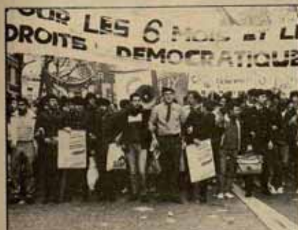
Las promesas electorales de Mitterrand se tornan ahora en represión contra los soldados rebeldes.

Todo ello demuestra la estrecha relación que hay entre la lucha contra la carrera de armamentos en los países imperialistas —y en los del Pacto de Varsovia también— y las luchas de liberación del Tercer Mundo, que se ven enfrentadas a esas numerosas guerras "locales" que les lleva al imperialismo. Y destaca la urgencia de la movilización pacifista, aunque sólo sea por correr en defensa de los que luchan en Centroamérica y el Caribe, en Oriente Medio y África. Por eso sólo va a valer la pena. ■