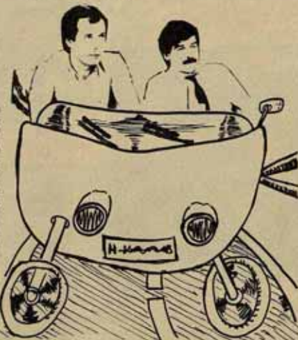
La teoría del sidocar a cómo enganchar al PCE a la moto del PSOE. Así lo ve nuestro dibujante IRV.

resulta difícil el documento encontrar algunos temas de desmarque táctico con el PSOE: una ley electoral proporcional; la retirada de la LOAPA y una política de rápidas transferencias; la desmilitarización de la Policía y de la Guardia Civil; la legislación del aborto; la oposición a la LRU y al proyecto de LODE; etc. Pero se advierte fácilmente la falacia de este supuesto político de izquierda, al ser que habrá que esperar a la maravillosa fase de la Democracia Política y Social para que culmine el desarrollo pleno del Estado de las Autonomías. Por otra parte, las «ayudas» en el terreno de la desmilitarización de la policía tienen por objetivo crear las condiciones para que se pueda ver al policía como un trabajador que pertenece al conjunto de los asalariados. Y, como ha concluido la transición, el problema del golpismo puede desahucarse en una sola línea: «la plena democratización de los aparatos de Estados. Lo cual, naturalmente, irá acompañado de una enseñanza militar, que, por lo que se lee, incluye el suficiente