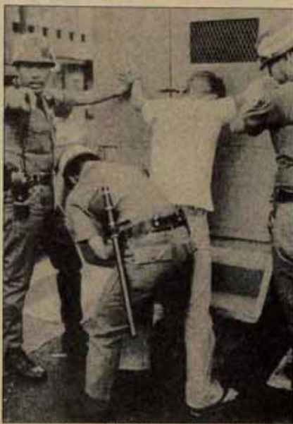
La crisis del régimen está abierta. Sin embargo, los grupos de oposición no parecen capaces de emprender la lucha directa por el poder.

Probablemente sea esta la razón por la que fue asesinado antes de poder intervenir en las luchas políticas por la sucesión de Marcos. La muerte de Aquino significa la desaparición de la mejor carta —quizá la única, pues será difícil sustituirlo— que le quedaba por jugar a Washington, si las fracciones inte-