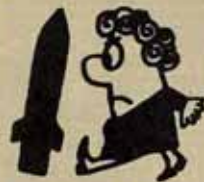
tenace al terreno de la hipotética feñética.

Estas políticas de socialdemócratas y eurocomunistas muestran la importancia de las iniciativas propias del movimiento antiguo. Desde hace algunos meses se desarrolla un referéndum "autogestionado", que ha obtenido ya un éxito innegable. Lanzado a nivel local y regional, tiene el objetivo de recoger cinco millones de firmas contra la instalación de la base de Comiso — como de cualquier otra base del mismo tipo en cualquier lugar de Italia — y por la convocatoria de un referéndum oficial a escala estatal. □