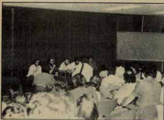
Auzolan se explica ante periodistas y militantes en Donostia