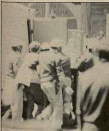
Solidaridad con los 11 reclusos de Bilbao. 28/XX/82.

C ON esta política de debilidad hacia la Iglesia y los aparatos del Estado el gobierno del PSOE sólo consigue colaborar en el cerco contra sí mismo y en la amenaza contra las libertades de todos. Si las energías gastadas para reponer las banderas rojigualdas en los Ayuntamientos de Euzkadi se emplean en remover de sus puestos a todos los mandos militares que no ofrecen garantías democráticas; si el dinero que reclaman los obreros de Sagunto para inversiones se sacara de los presupuestos militares y de las subvenciones a la escuela privada; si la cacería para traspasar las competencias que reclaman Euzkadi, Catalunya y el resto de nacionalidades se empleara en recuperar las competencias que la Iglesia ha usurpado a la escuela pública; si el celo puesto en investigar los coches que compran los jornaleros andaluces con el empleo comunitario; se empleara en recuperar las competencias para castigarlos ejemplarmente. Si, en definitiva, la energía se utilizara contra la derecha y los poderes fácticos y no contra los trabajadores y el pueblo, la causa de la libertad estaría bastante mejor defendida. □