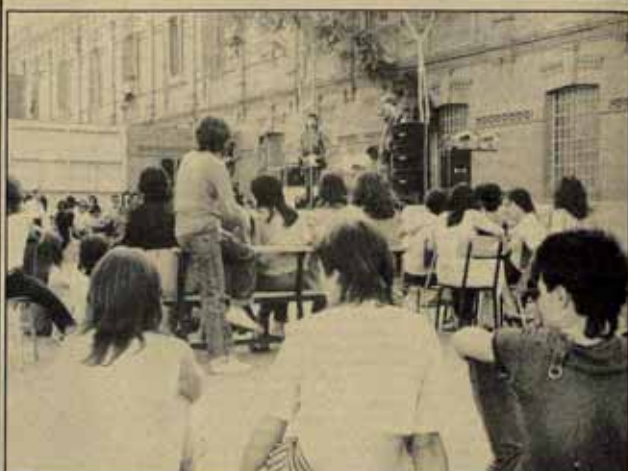
El concierto no fue una fiesta. Los músicos se esforzaron sin embargo, por cantar, "tumbar" y contar cosas. Nadie estaba allí para justificar nada.

No se puede dejar de leer sólo porque los libros son caros. Tenemos el derecho de instrumentos — un derecho que es igual un deber — y podemos cumplirlo. □