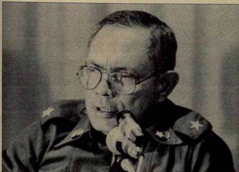
La farsa de las relaciones ETA-FSLN busca aislar a Nicaragua de Europa en el peor momento.