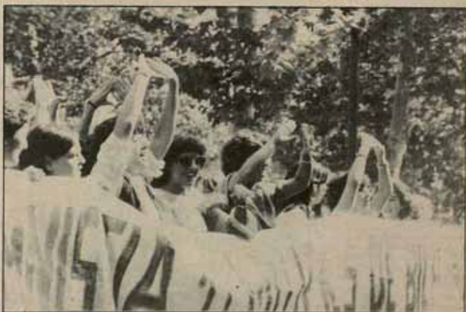
La policía se enfrentó a contar con los comunistas jefes de la BPS. (ISKRA PRESS)