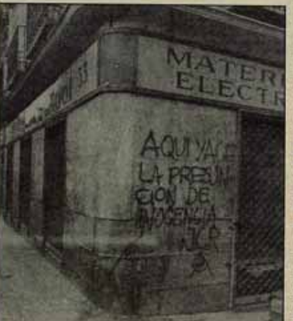
Bajo el letrero "El Caso" publicó la fotografía de nuestro denuncia del crimen.

Pero todo esto no indica más que se ha hecho millonario y que como tal hay que tratarlo, digo yo. De todas formas hay otras cosas que depende de don Miguel. Cualquiera que conozca el fingido de organización de un festival sabe lo que vive y lo que no, si me tardar que un alguila. Miguel Ríos también sabe lo que lleva por esas "gales" de Dios (¿¿) un mal apaño que, escandalosamente, le mald de los vecinos no marcha. Y eso pensando con millones en su mano, y con menos, se llama desmesuras con los "colégas" o merri cantidad