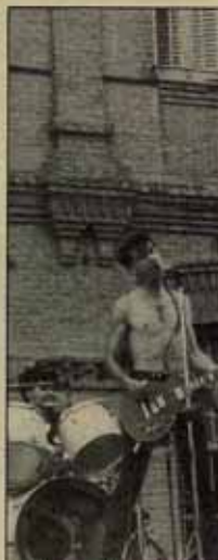
El grupo punk P.V.P. fue el más aplaudido. Sus canciones de odio al sistema corrieron allí.

El ambiente resultó deprimente en cantidad, al menos para los músicos: algunas de las intenciones se desvirtuaron. Claro, todo lo que puede uno divertirse cuando está rodeado de muros espesados, sin poder salir, y de labios y ojos inquietos—que los de los carceleros— que vigilan cualquier movimiento sospechoso. No. Yeserías no fue una fiesta aquel día. No podría serlo nunca: esos lugares no se prestan en absoluto al festivo, a la broma ni a la diversión. Lo más que puedes hacer dentro de ellos, aunque seales como visitante, es tratar de apartar el tipo y de pasar por alto las provocaciones de los que no dejan de hacerte objeto los cuerpos represivos, que parecían estar haciendo un favor a los músicos, de "desaharlos vivir". Dos compañeros quisieron ir al concierto, y se les negó el permiso. Algo habría que ocultar, tal vez el ambiente aún más deprimente que debe existir en el interior de la prisión, que no en el patio.