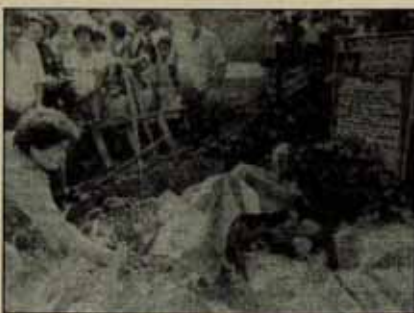
...Y no quisiera morirme, aquí y ahora, para no darle a mis huesos tierra española

Nos parece que no es hora de hacer una nota necrológica. Bergamín murió el 28 de agosto, hace ya algunos días. Además, para leer una fría reseña biobibliográfica, ya están los periódicos diarios, que han cumplido su papel de informantes. Lo que importa es contar quién era Bergamín, y, sobre todo, por qué su muerte ha causado esa profunda conmoción en el país sobre todo en la prensa. Un escritor ya anciano, que vivía en San Sebastián desde hace un año. Un escritor de obra importante, pero que había querido mantenerse lejos de la España oficial, la que da premios y hace embrietas, por su desconfianza radical — esto es, de raíz, y no sólo de detalles — con el régimen del Estado: republicano, antifrancista, en un equilibrio difícil entre el catolicismo y el comunismo — no el marxismo; el comunismo, que hay una cierta diferencia —, ha vivido en una perpetua negación. De su generación política, la del '27, decía: «ya generación del '27, ni era del '27 ni era nada». Lo importante de Bergamín es que vivió fuera de las cadenas donde se le quiso meter — "intelectual de izquierdas", "pensador católico", "poeta comunista" — y sacó de sus casillas a los demás; a todos los demás.