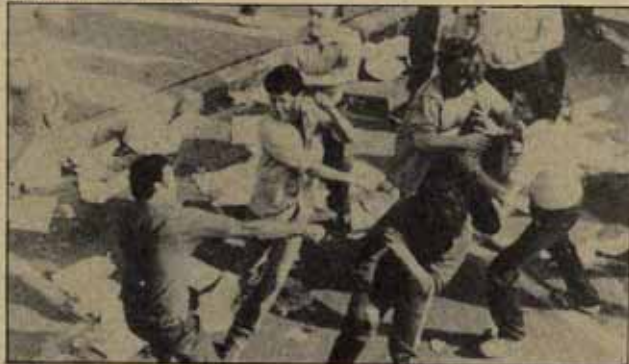
Y otros cuantos cadeneros en la calle a los portadores de la ikurrña.

El Gobernador no permitió siquiera la alternativa de la retirada conjunta de