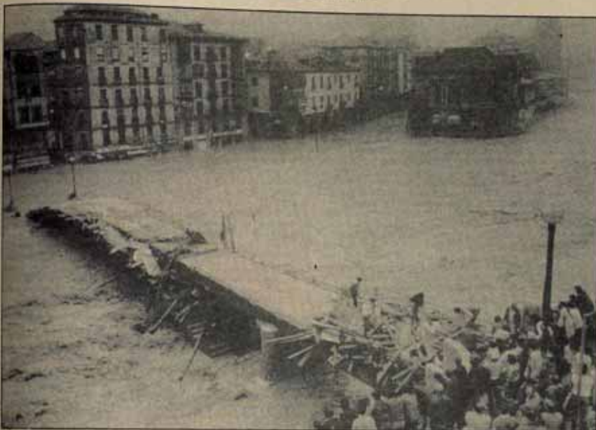
EUSKADI TRAS LA RIADA