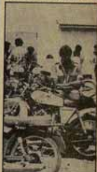
Los desempleados ocupan la finca "El General".

Esta semana, conocida por las perlas que acudieron el pasado domingo, tras la manifestación de solidaridad con Chile, ante el Gobierno Civil de Sevilla para exigir la libertad de los 8 jornaleros de El Coronil, desahuciados y en huelga de hambre, resume claramente cómo sucedieron las hechas.