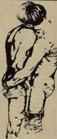
blie. En esta campaña de rechazo a la intolerancia hay que denunciar también la falta de compromiso por parte del gobierno, respecto a las propuestas presentadas por grupos gays en el mes de febrero ante los ministerios de Justicia e Interior. Exigimos pues, garantías contra toda discriminación y porque caminamos hacia la liberación sexual, queremos que se cumplan los acuerdos antidiscriminatorios del Consejo de Europa firmado en 1981 por el PSOE.

En esta celebración del orgullo gay queremos manifestar nuestro rechazo a la tolerancia, ya que significa también: discriminación y opresión. No es necesario recordar que en los lugares de encuentro gay se siguen haciendo redadas policíacas, avalidas por cualquier denuncia, no siempre justificada. Los medios de comunicación por su parte siguen sensacionalizando la cuestión homosexual, vendiendo noticias insultantes, y por aún, manipulando las informaciones en casos tan graves como la SIDA (síndrome de inmunodeficiencia adquirida), tema inicialmente médico que se ha convertido en un ataque frontal a las relaciones homosexuales y a algún programa se muestra excepcional y un gay es entrevistado en TVE y su reacción del señor Fraga y su séquito se hace más que intolerante.